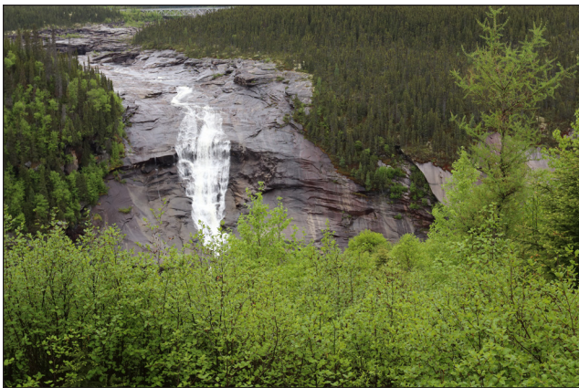
Quand Patshishetshuanau a été renommée Churchill Falls, la signification de son appellation innue, «Là où le courant fait des nuages de vapeur», n'a pas suivie... Des efforts locaux, notamment de la part de Mamu Tshishkutamashutau Innu Education, ont pour mission de préserver les noms de lieux innus.

Les discussions budgétaires provinciales se sont, quant à elles, tenues en ligne du 1 er au 5 février dernier. Cependant, le questionnaire en ligne ( www.engagenl.ca/en/budget-2026 ) peut être rempli jusqu'au 18 février. Il est également possible d'envoyer des commentaires écrits par la poste, ou par courriel à l'adresse: Budget2026@gov.nl.ca .