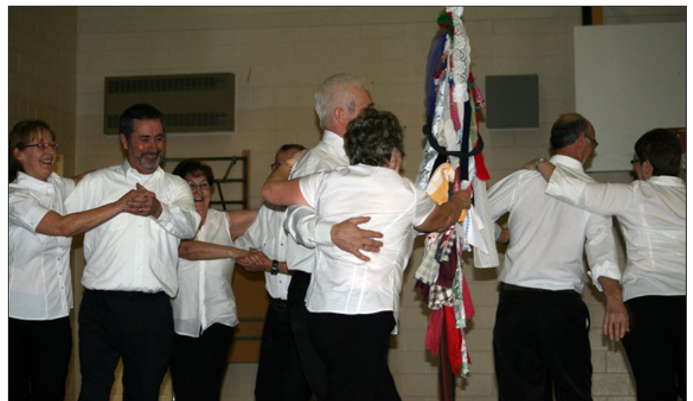
Le musée de l'Héritage de l'île Rouge, logé dans le Centre scolaire et communautaire Sainte-Anne, à La Grand'Terre, a parmi sa collection une magnifique gaule, objet symbole des célébrations traditionnelles de la Chandeleur dans la péninsule de Port-au-Port. Traditionnellement, pendant les fêtes de la Chandeleur, les membres des communautés dansent autour du roi, qui porte avec lui la gaule.

Votre journal de langue française n'a pas de météorologues parmi son équipage. Cependant, Le Gaboteur est là pour vous réchauffer le cœur, que ce soit pendant votre hibernation hivernale ou pour vous guider vers le printemps!