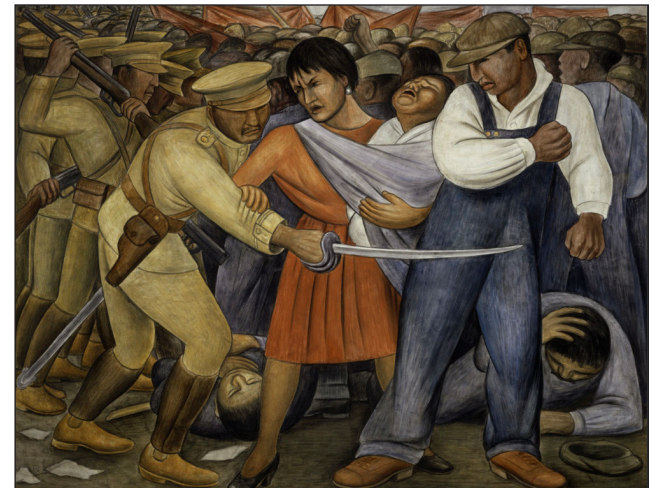
Peinture: The Uprising (1931) de Diego Rivera

Ce poème et ce chant doivent être, pour quiconque, motifs d'une espérance qui sait, malgré tout, que le pire n'est jamais nécessaire et que le bien peut faire valoir ses droits. Cette espérance, nous sommes nombreux à le sentir, nous sera plus que jamais nécessaire dans l'année à venir.