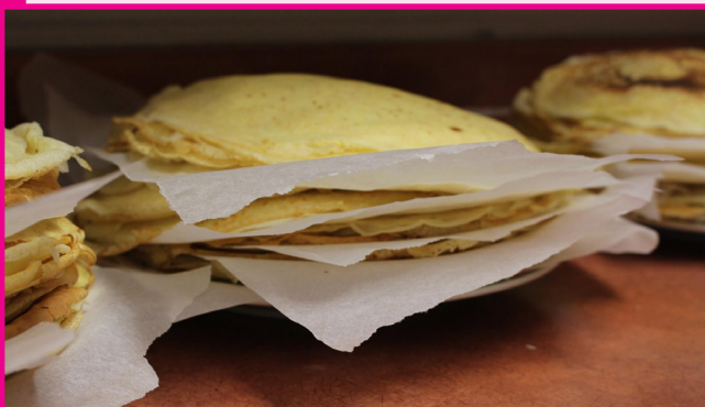
Crêpes des célébrations de la Chandeleur.