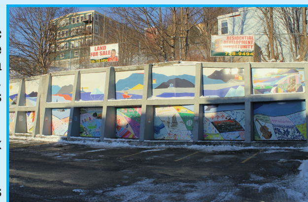
Rendez-vous au stationnement en face des bureaux du Gaboteur pour voir cette formidable œuvre collaborative de près et tentez d'identifier les carrés peints par deux journalistes de l'équipe du journal.

L'installation de la murale à grande échelle sur la rue Duckworth s'est faite fin novembre 2025, suivie d'une inauguration officielle quelques semaines plus tard. [JT]