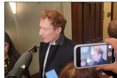
Le ministre Marc Miller a admis que son ministère peut faire mieux concernant l'obligation de consulter les conseils scolaires francophones provinciaux du pays, en en l'occurrence, dans le cas le plus récent, soit celui de Terre-Neuve-et-Labrador.

comme en Colombie-Britannique. Le conseil scolaire francophone de cette province avait porté plainte auprès du Commissaire aux langues officielles pour la même absence de consultation de la part du ministère. Le commissaire lui avait donné raison dans un rapport paru fin novembre.