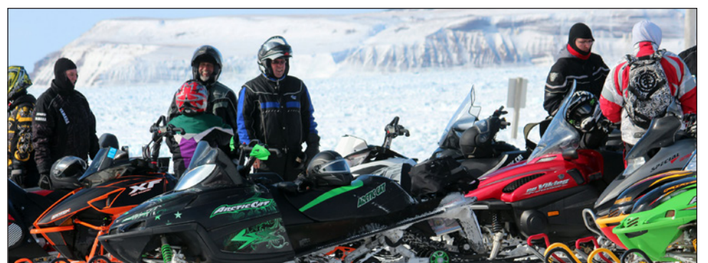
Les motoneigistes se rassemblent souvent en hiver sur la péninsule de Port-au-Port, comme dans le cadre des Carnavales d'hiver, qui ont lieu normalement au mois de février.

En plus d'un nouveau poêle à bois à la cabane de Carp Creek, près de Pasadena, donné par la mairie de ce dernier, l'organisme a également annoncé le 26 novembre sur ses réseaux sociaux la construction d'une nouvelle rampe à l'entrée de la cabane de Pasadena grâce à la subvention Restons dehors de Yamaha, qui finance des projets de plein air.