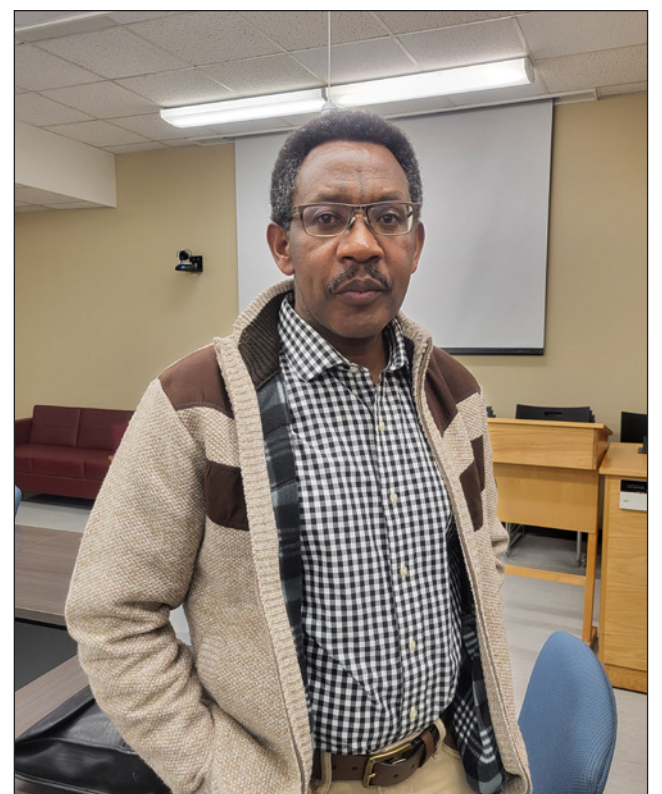
Impossible d'oublier le contraste saisissant entre la description brutale des événements et le vocabulaire magnifique employé par le professeur.

ment, l'université est prête à organiser un événement pour enseigner le génocide rwandais, mais, lorsque cela ne leur convenait pas, ils refusaient même d'admettre son existence.»