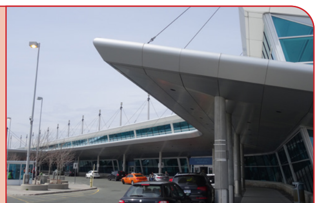
L'aéroport international de St. John's.