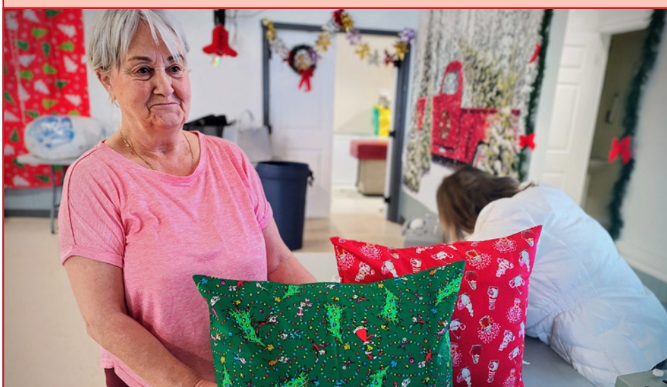
Une participante de l'atelier à Cap Saint-Georges présente fièrement ses nouveaux coussins de Noël.

L'atelier a permis aux participants de fabriquer leur propre oreiller, et ensuite de choisir un tissu festif et confectionner une taie personnalisée. Les taies peuvent être enlevées et lavées, et madame Fenwick compte proposer un deuxième atelier quand les temps commencent à réchauffer pour que les aînés puissent fabriquer des taies printanières. [JT]