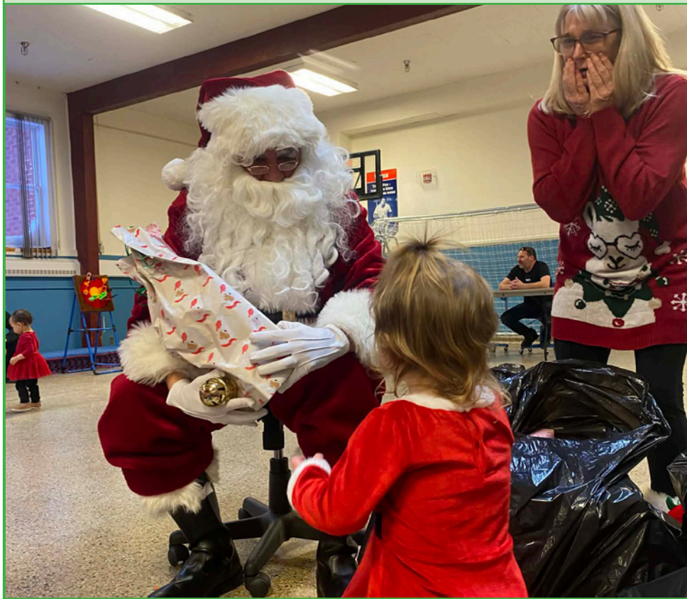
Le père Noël remet un cadeau à un enfant.

Le père Noël s'est arrêté à l'École l'ENVOL à Labrador City le 7 décembre dernier, au grand plaisir des enfants francophones de la région. L'événement organisé par l'Association francophone du Labrador a accueilli un grand nombre de personnes. On s'est amusé à créer des épées et des chapeaux avec des ballons, entre autres activités, et une collation était offerte à tout le monde en présence. À son arrivée, le père Noël a remis un cadeau à chacun des enfants. C'était un après-midi mémorable, rempli de beaux souvenirs. [JT]