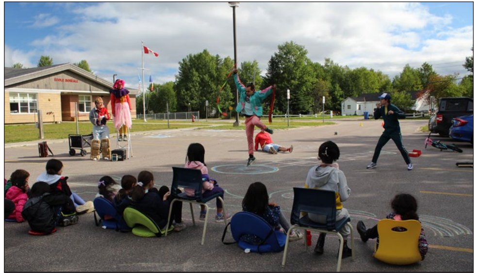
La météo à Happy Valley-Goose Bay était très agréable lors de la représentation d' Amarelinha , qui se produit normalement en plein air.

Amarelinha est l'histoire d'un groupe d'amis qui a grandi ensemble. Ils sont en train de jouer dans la ruelle quand une nouvelle fille les rejoint et on