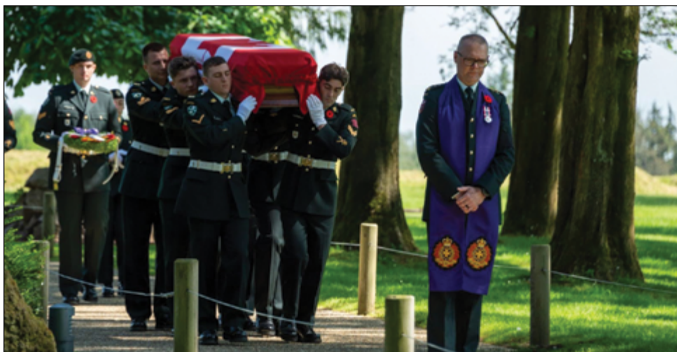
Des membres du Royal Newfoundland Regiment portant le cercueil du soldat inconnu vers le corbillard à Beaumont-Hamel.