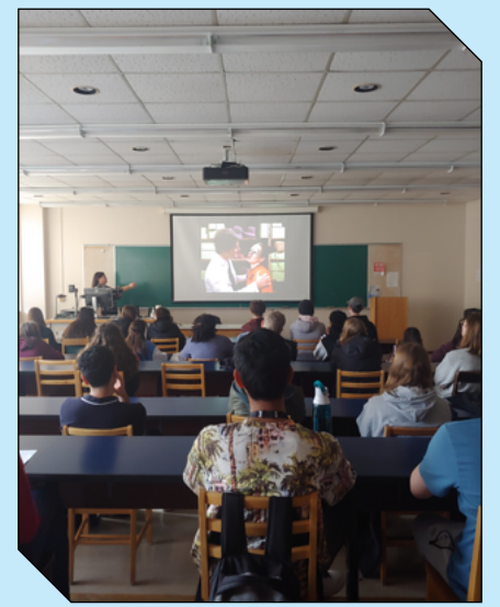
L'Office National du Film a mis un coup de projecteur sur le cinéma canadien lors du Forum Français pour l'avenir.