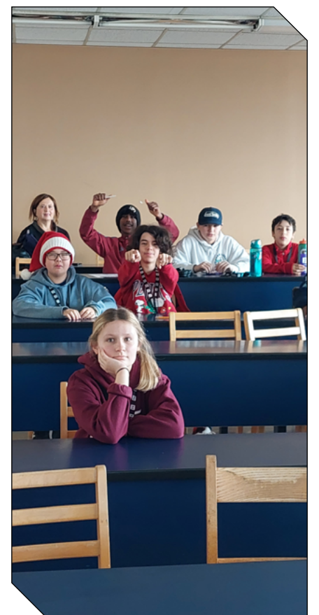
Les élèves explorent différentes possibilités d'emploi pour l'été avec le YMCA.