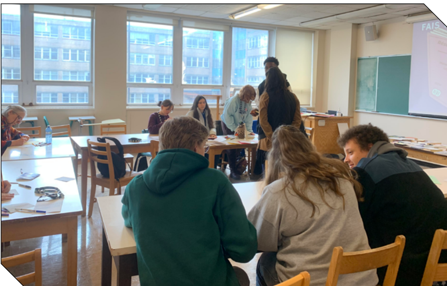
Sur cette photo, on voit des élèves qui apprennent à faire des couvertures de livres et à exprimer leurs talents artistiques.