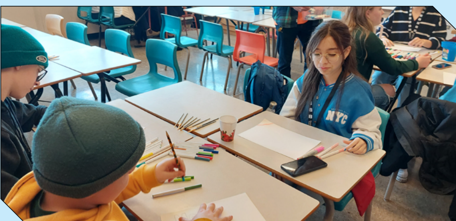
L'atelier linguistique et créatif, organisé par la branche provinciale de Canadian Parents for French, a ajouté de la couleur à la journée. Du joul québécois au slang terre-neuvien, les élèves francophones et anglophones ont tous découvert de nouveaux éléments de vocabulaire.