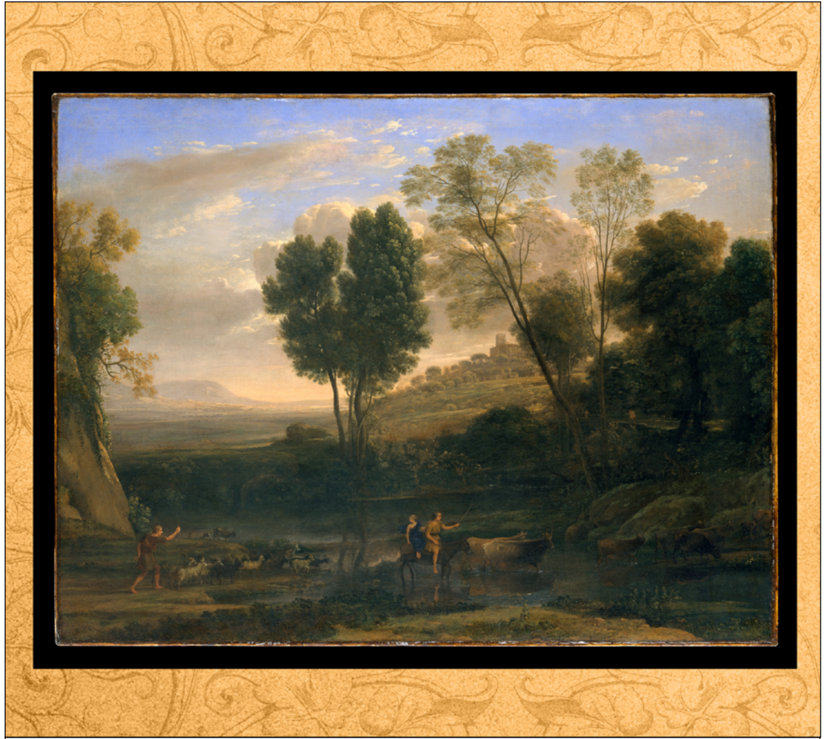
L'Aube, tableau réalisé par Claude Gellée en 1646.

La nouvelle année s'ouvre habituellement sur une litanie de souhaits. On se souhaite entre nous, entre amis ou entre inconnus, de la santé, du bonheur, de la joie, de l'amour. Et ces vœux vagues adressés à autrui sont doublés d'attentes et d'espoirs par rapport à soi-même; de ces résolutions qu'on se fait comme des promesses. On se dit qu'on va commencer à aller au gym, qu'on va lire tel ou tel livre, qu'on va faire ceci ou faire cela ; on se dit qu'on va finallement commencer à vivre autrement. Le premier janvier devient alors la date imaginée, fantasmée, du début d'une nouvelle vie et de la fin de l'ancienne.