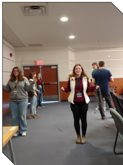
Ces élèves découvrent les joies du cirque avec l'Université Sainte-Anne.