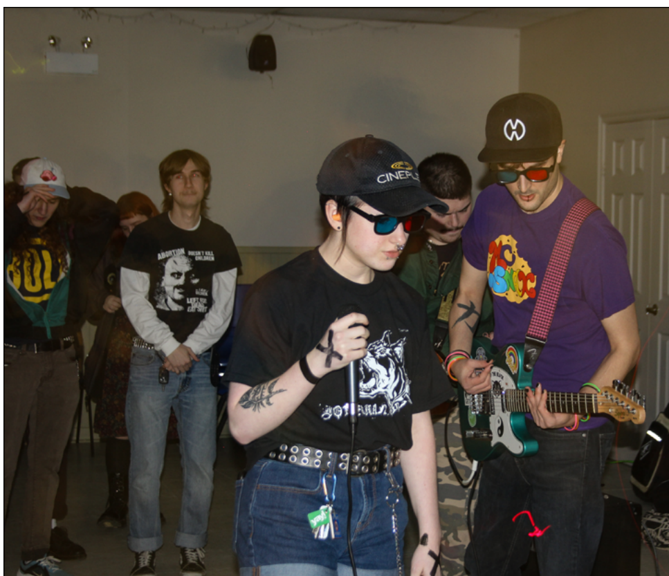
Le groupe Life Jolt remplit toujours la salle, n'importe où se déroule le concert.