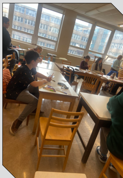
Les élèves francophones et anglophones travaillent ensemble au cours de différents ateliers tout en se faisant des amis avec des jeunes d'autres écoles. Ici, on peut voir un enfant à l'atelier «À chaque histoire sa couverture», organisé par les Bibliothèques publiques de Terre-Neuve-et-Labrador. Les participants travaillent sur une couverture à partir de la description d'un vrai livre. Ils devaient utiliser différents styles créatifs afin d'en venir à un titre pour les dessins représentant l'histoire du livre.