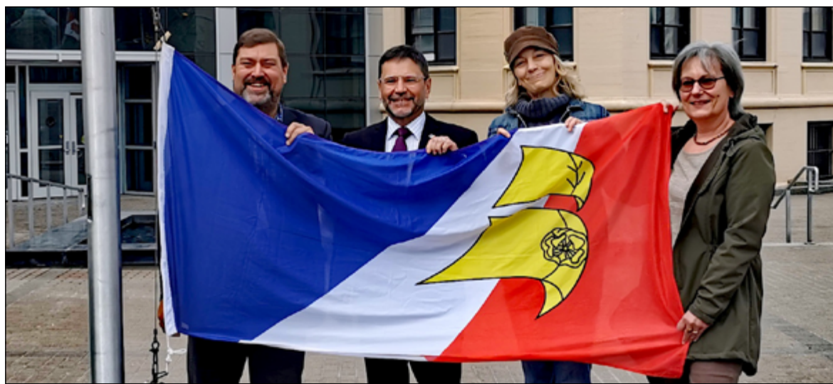
Corner Brook