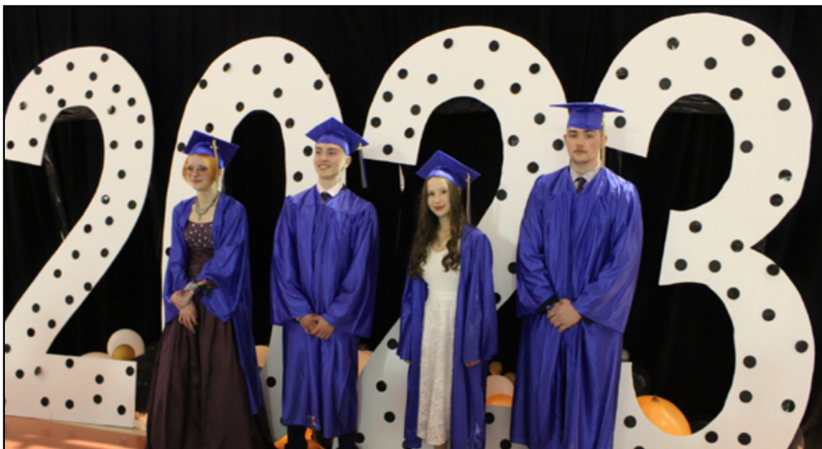
Une belle cérémonie pour les finissants de l'École Rocher-du-Nord, à Saint-Jean.

Le mois de mai a été l'occasion pour certains étudiants de célébrer leur fin de parcours scolaire, au sein du CSFP.