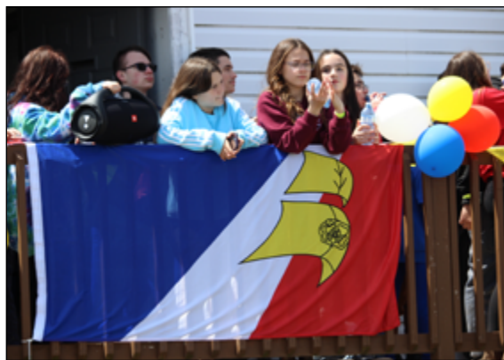
Cap Saint-Georges

De la France à Plaisance French Shore, Port-au-Port Un pas après l'autre, Terre-Neuve-et-Labrador