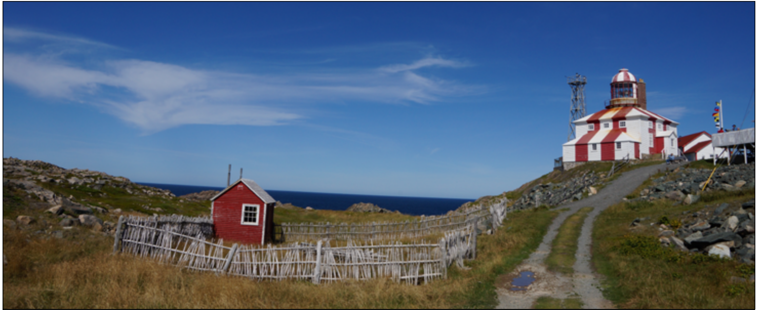
Le phare du cap Bonavista.

ExploreTNL se prépare à lancer une série de vidéos qui éclaire plusieurs centres d'intérêt. Chacune des vidéos montre la province à travers les yeux des habitants, qui possèdent un dynamisme que madame Saltel souligne avec passion. «J'ai demandé à huit personnes de la diversité, de l'inclusion, qui représentent la Francophonie, de venir avec moi et de partager leurs passions ou leurs activités, ou démontrer la vie quotidienne, qui ils sont,