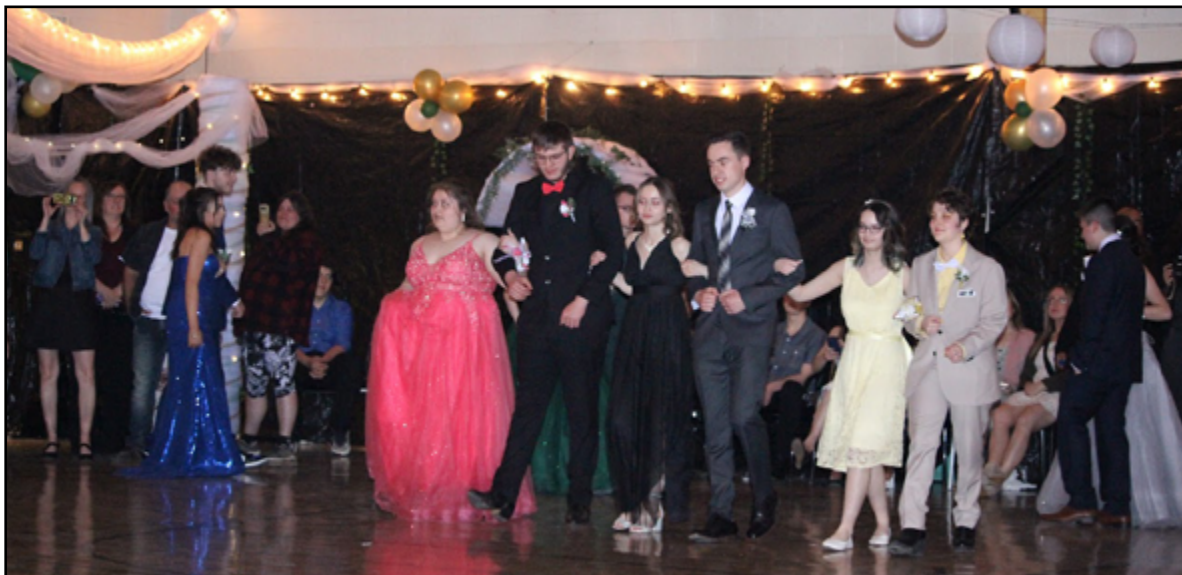
Une photo du bal des finissants à l'École Sainte-Anne, à la Grand'Terre.