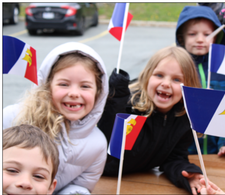
St. John's