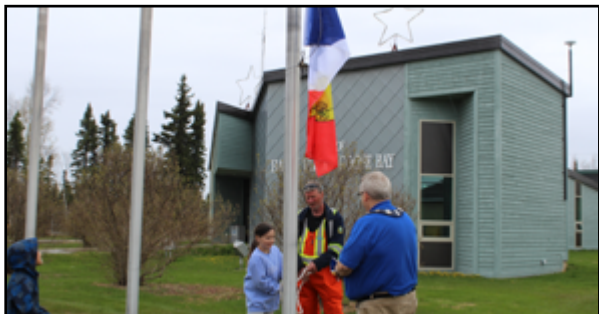
Les élèves de l'École Boréale ont participé à la levée du drapeau, à Happy Valley-Goose Bay.

Les six écoles du CSFP ont célébré la francophonie à Terre-Neuve-et-Labrador, le 30 mai 2023. Elles ont organisé différentes activités pour les élèves et la communauté. Découvrez quelques-unes de ces activités en photos.