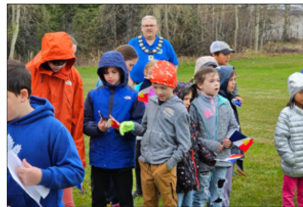
Happy Valley-Goose Bay | Photo: Courtoisie

Le 30 mai dernier, la francophonie provinciale a fêté leur fierté lors du 18 e anniversaire du décret provincial.