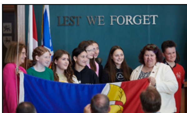
L'École Rocher-du-Nord s'est rendue à la cérémonie organisée, par la FFTNL, à l'édifice de la Confédération à Saint-Jean. L'équipe du Siège du CSFP était également présente à l'évènement.