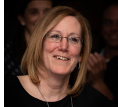
Brenda O'Farrell Photo: Courtoisie