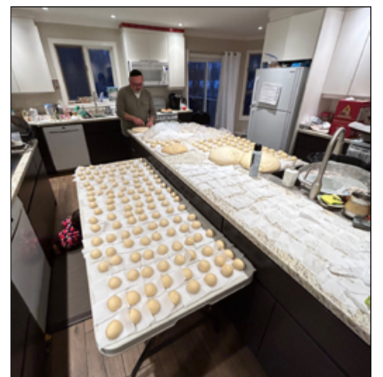
En vue de la fête du 10 décembre, j'ai donné un coup de main au rabbin et à la rebbetzin pour préparer 600 beignets fourrés à donner au public.

Cette année, on a allumé la grande menorah le 10 décembre dernier au même endroit. Le 12 décembre, on a aussi organisé un défilé d'autos! En vue de la grande fête, j'ai participé à la préparation de 600 beignets fourrés – un véritable boulot!