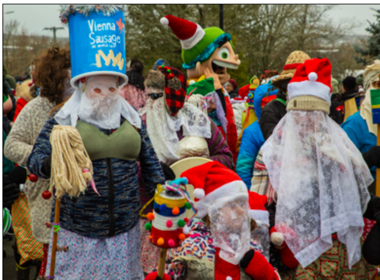
Dangereux ou amusant? Le Gaboteur n'a vu qu'un seul danger lors de la parade des mummers : des gens qui dansaient un peu trop fort!

Au tournant du siècle et même aujourd'hui, le mumming n'a jamais complètement disparu dans les régions rurales, même en dépit de l'interdiction jusqu'aux années 1990. Les documents de l'époque décrivent cette pratique avec de plus en plus de nostalgie, explique la chercheuse. Aujourd'hui, si la tradition est devenue un festival organisé dans la capitale, pendant les périodes de fêtes on peut toujours trouver un ou deux mummers dansant de maison en maison surplombant les baies et criques de la province.