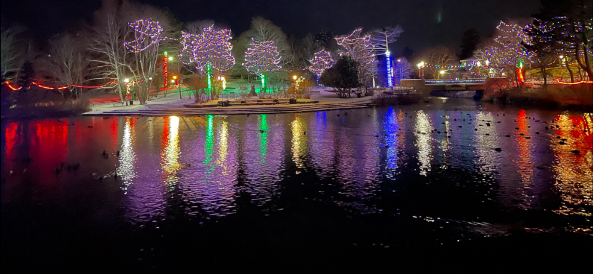
Chaque année, les townies ainsi que les gens du bay viennent voir le parc Bowring, surtout la nuit. La mare aux canards reflète les lumières, doublant ainsi leur beauté. Les lumières projettent des traînées dans l'eau, ressemblant à une peinture à l'aquarelle.

Les photos de la capitale, toute décorée et illuminée pour le temps de fêtes, sont aussi connues que les maisons de Jellybean Row. Ces lumières semblent apparaître du jour au lendemain, comme si elles avaient été posées par des lutins au cours de la nuit.