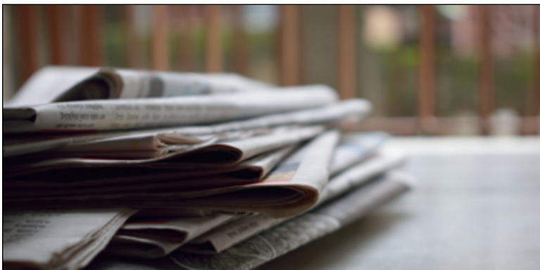
Un collectif pour redistribuer l'argent de Google aux médias sera créé dans les prochaines semaines.

Pour Jean-Hugues Roy, une action de la part du gouvernement est nécessaire afin d'obliger Meta à garder la circulation des nouvelles sur le territoire canadien. «Beaucoup de Canadiens s'informent grâce à Instagram, grâce à Facebook, il faut forcer. Il y a des arguments qui justifieraient qu'un État oblige Meta à avoir de l'information», conclut-il.