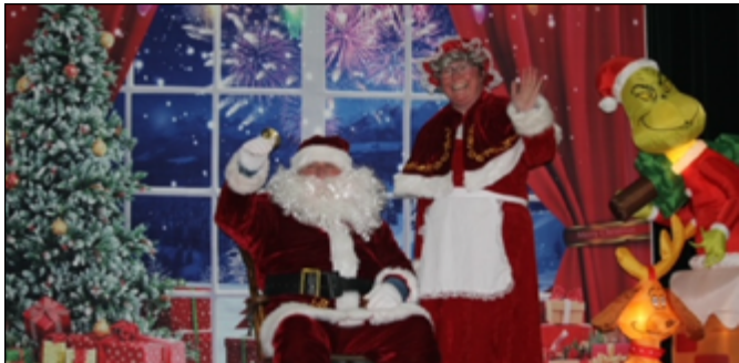
Le grand Père Noël et la Mère Noël sont venus à Cap Saint-Georges et à La Grand'Terre où ils ont distribué des cadeaux aux sages enfants de la péninsule.

Les festivités hivernales de la péninsule de Port-au-Port se sont déroulées en double au début du mois, avec une parade à La Grand'Terre et une deuxième à Cap Saint-Georges le 9 et 10 décembre derniers. Retour en photos de Naomi Felix-Gaddes, qui a pu rencontrer le Père Noël quelques semaines en avance de la grande soirée de travail de ce dernier le 24 décembre prochain. (LF)