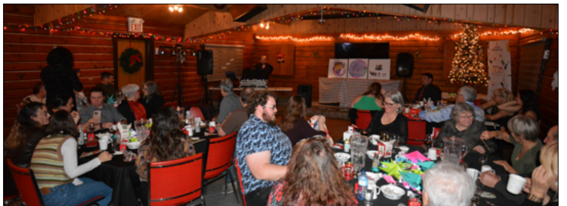
Une ambiance divertissante régnait lors du festin de Noël.