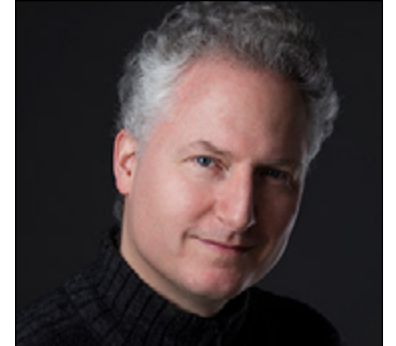
Jean-Hugues Roy Photo: Courtoisie