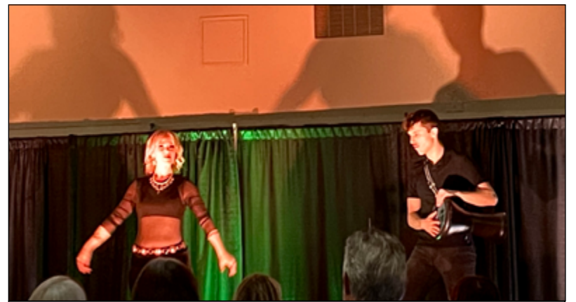
Diverses représentations, notamment de danse, de musique et de lip syncs, ont divertifié le public toute la nuit.

Tout au long de la soirée, les participants ont eu un avant-goût de Noël avec un tirage au sort de prix et de cadeaux.