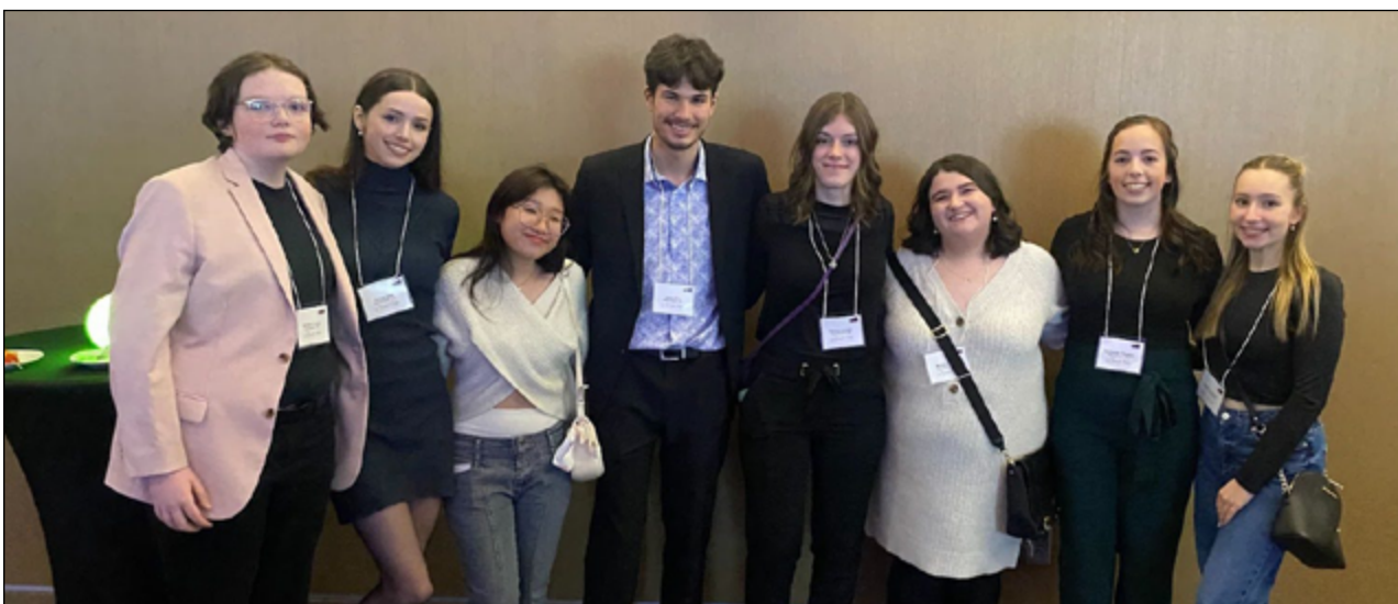
Les participants du programme Frecker de 2023.