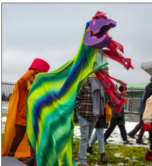
Quelques hobby horses ont défilé avec les mummers lors de la parade qui s'est déroulée au Bowring Park le 9 décembre dernier.

Pour sa 15 e édition, le Festival des Mummers a proposé un calendrier bien rempli d'ateliers de fabrication de costumes et accessoires. La parade se déroulant quelques semaines avant le congé des fêtes, le festival souffle une atmosphère festive sur la ville qui se prépare pour l'hiver. Maude-Julia Blanchet