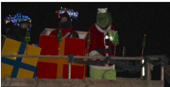
Les festivités à la péninsule donnent tellement envie que même le Grincheux s'est présenté!