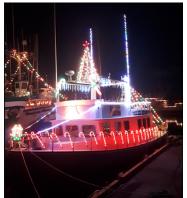
Ce n'est pas grave si vous n'avez pas encore eu l'occasion de voir les bateaux dans toute leur splendeur. Chaque soir, les bateaux s'illuminent et l'on croirait voir des aurores boréales sur l'eau.

À une heure de route du centre-ville, vous ne verrez pas seulement le port embelli par les bateaux, mais aussi le plus grand arbre de Noël en forme de pot de crabe. Du crépuscule jusqu'à minuit, ce festival populaire offre une expérience enrichissante et gratuite aux visiteurs. Cette année, il y a un kiosque d'accueil et une nouvelle signalisation pour aider les visiteurs à explorer et à se retrouver dans la zone du festival. (LF)