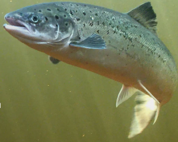
Le saumon atlantique ( Salmo salar ) observé au Centre d'interprétation Salmonid à Grand Falls-Windsor.

La population de saumon de Terre-Neuve-et-Labrador continue à s'améliorer selon le dernier recensement de Pêche et Océans Canada de cette année. Une nette amélioration depuis 30 ans, mais la santé de population varie de rivière à rivière. Oleksii Pivtorak