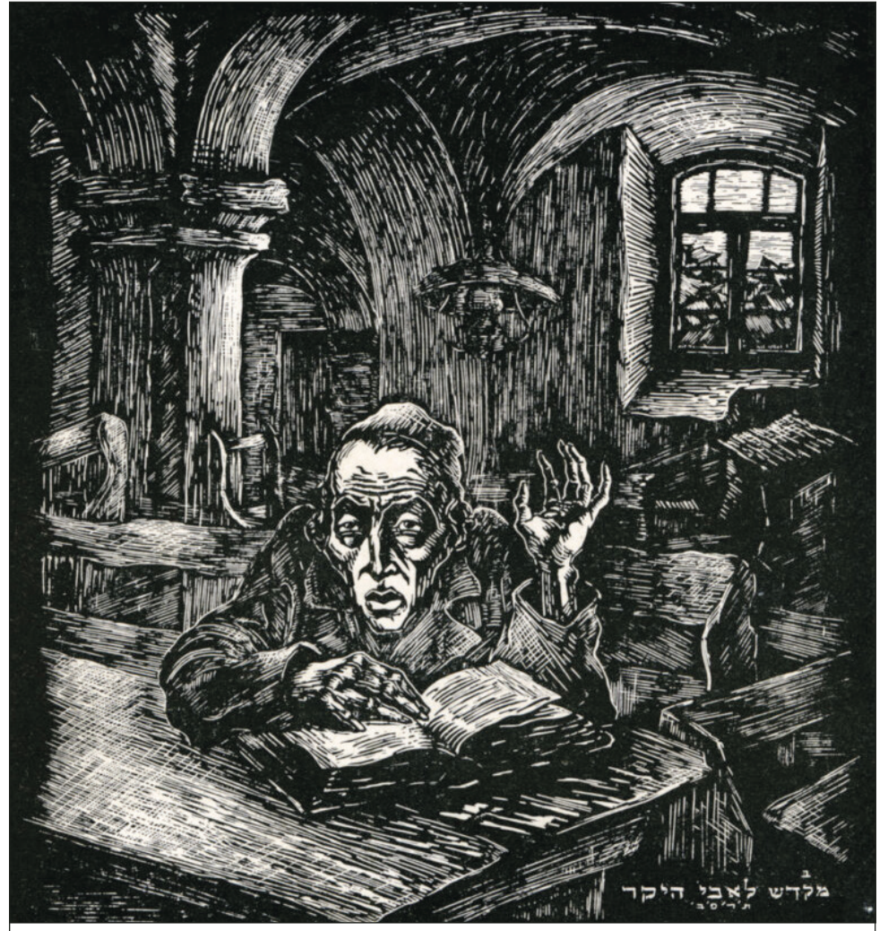
L'étudiant assidu (1921) de Josef Budka.

L'école est un lieu de symboles tout autant qu'un lieu d'apprentissage, sur lequel la société projette ses craintes par rapport au futur et ses obsessions du moment. Le début de l'année scolaire devient ainsi un moment tout à fait convenu pour qu'une panique morale s'empare de l'espace public quant à l'état de l'école et de sa jeunesse. Cette année ne fait pas figure d'exception.