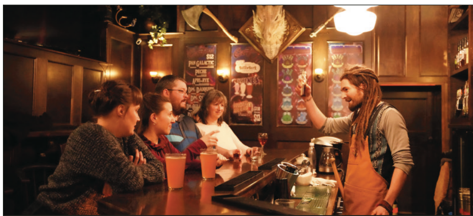
Une scène de la série Justine à St. John's, tirée du troisième épisode.