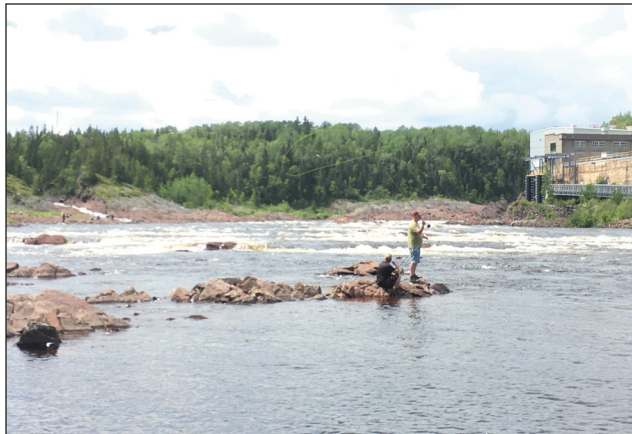
Un pêcheur sur la rivière Exploits.

Le coût d'un permis de pêche au saumon pour les résidents de type individuel et familial est de 23$. Le permis permet de garder deux saumons par saison.