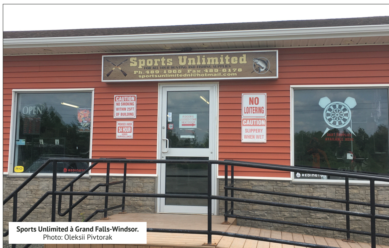
Sports Unlimited à Grand Falls-Windsor.