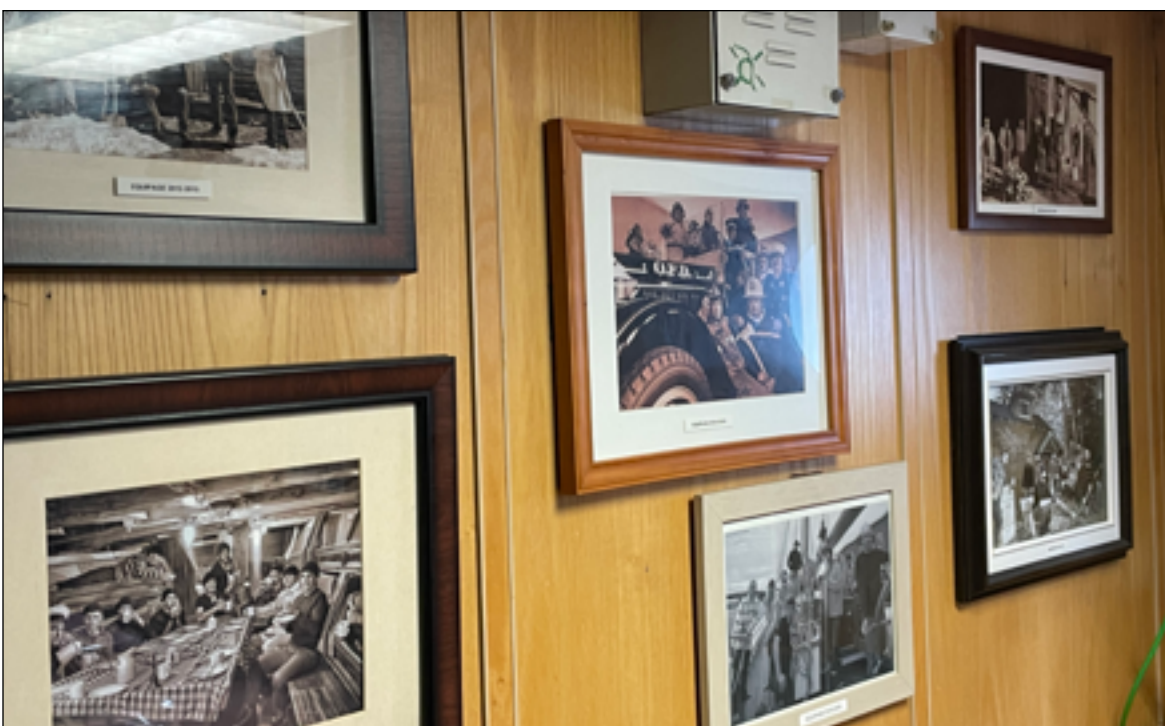
Images d'un ancien membre de l'équipage devenu photographe dans la salle à manger, le salon et la cuisine.