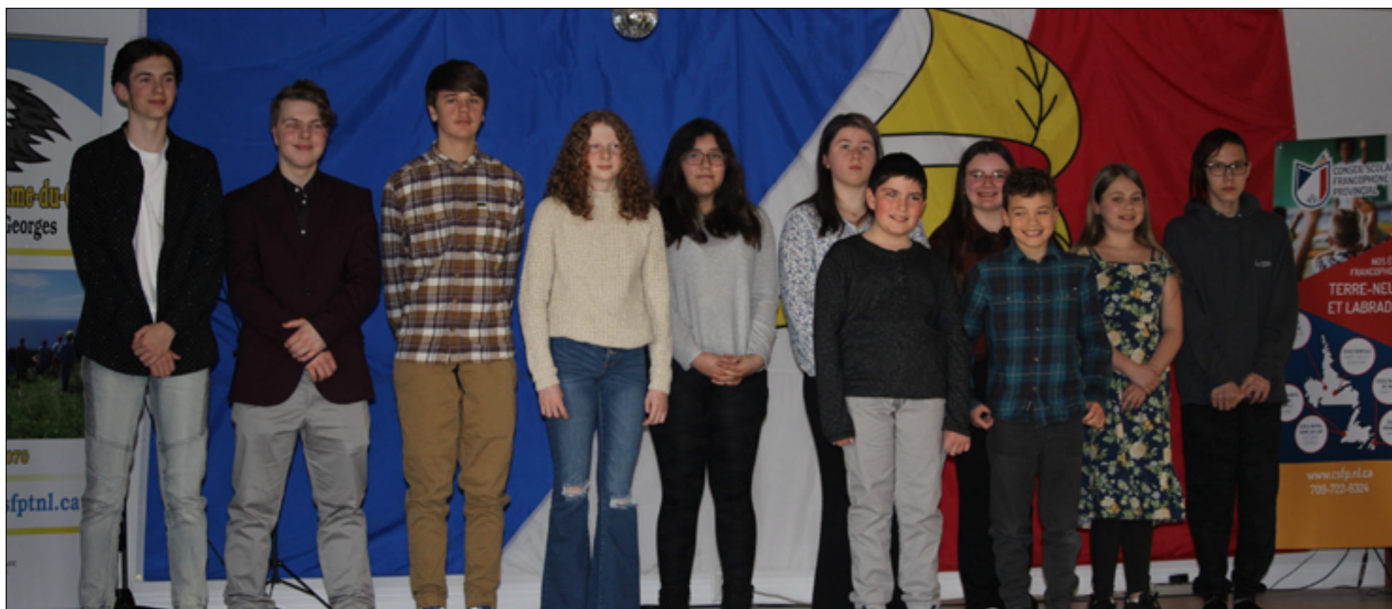
Les onze participants du concours d'art oratoire du CSFP sont tous des gagnants!

Non seulement un outil pédagogique, les concours d'art oratoire comme celui du CSFP et celui du CPF illuminent le chemin de jeunes.