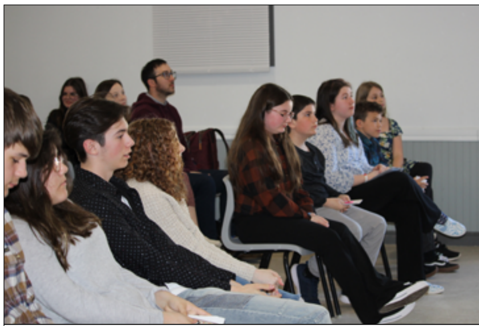
Le concours d'art oratoire du CSFP est l'une des occasions annuelles où les élèves francophones des quatre coins de la province se réunissent.

L'art de convaincre et de pouvoir émouvoir par la parole remonte au début du langage. À Terre-Neuve-et-Labrador, le concours d'art oratoire en français fait partie de la scolarité des jeunes depuis les débuts de l'immersion française.