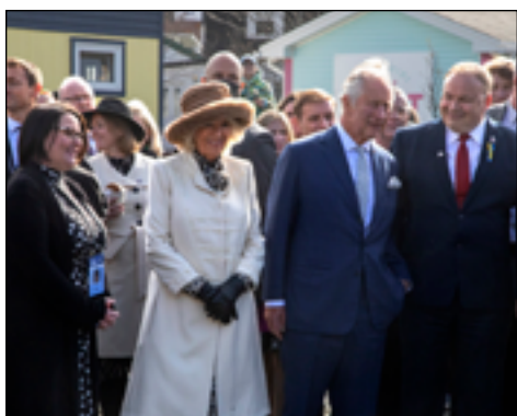
Le futur roi Charles et sa reine consort Camille Parker Bowles en visite au village de Quidi Vidi en mai 2022. Après une journée remplie de cérémonies, le couple royal a terminé leur journée sur le vieux Rocher en dégustant de la crème glacée et de la bière iceberg en admirant l'art aux ateliers du Quidi Vidi Plantation.

Fabriquée pour le roi Charles II en 1661, elle est sortie, avec les habits cérémoniaux, de la Tour de Londres encore une fois le 6 mai dernier, dans le cadre du couronnement du nouveau roi.