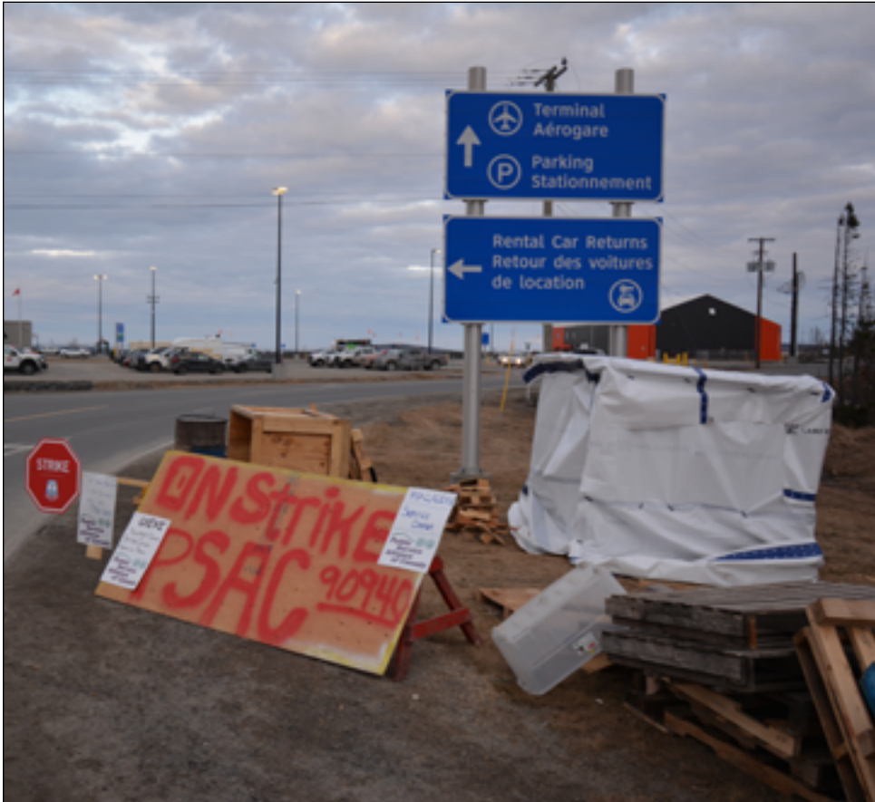
Les installations désertées du piquet de grève en face de l'aéroport de Wabush.

Les syndiqués de l'Union canadienne des employés des transports (UCET) qui travaillent pour le gouvernement fédéral à l'aéroport de Wabush et qui sont membres de l'Alliance de la fonction publique du Canada (AFPC) ont voté en faveur d'un mandat de grève, le 19 avril 2023, et ont érigé une ligne de piquetage au travers de la route d'accès menant au terminal aéroportuaire.