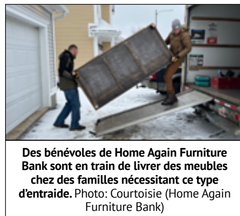
Des bénévoles de Home Again Furniture Bank sont en train de livrer des meubles chez des familles nécessitant ce type d'entraide.

Puisque Compas fait partie des clients de Home Again Furniture, avec près d'une quarantaine d'autres associations ou d'organismes communautaires, il suffit pour un nouvel immigrant francophone à St. Johns ou d'ailleurs de consulter le portail des