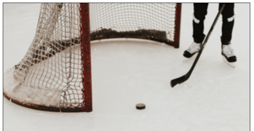
Le sport a pris une place importante dans les récents financements prévus pour le Labrador.