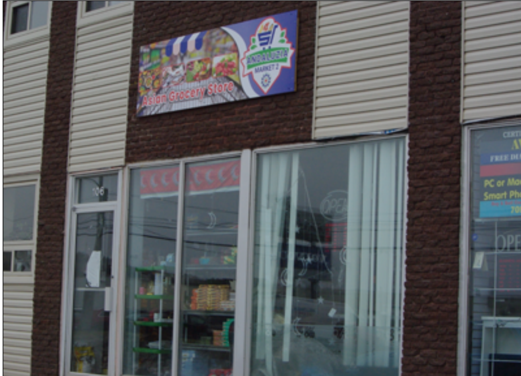
«On essaye de faire de notre mieux pour viser la plus large communauté dans les régions rurales», dit l'entrepreneur. «On sait que l'accès à ce genre de produits était toujours difficile dans ces régions, vu que j'ai vécu la même chose à mon arrivée à St. John's.»

L'eau de fleur d'oranger, le qamar al-din et le sobia, une boisson lactée et riche en amidon, sont tous populaires au Moyen-Orient et en Afrique du Nord pendant le Ramadan. Et aujourd'hui, même à Terre-Neuve-et-Labrador.