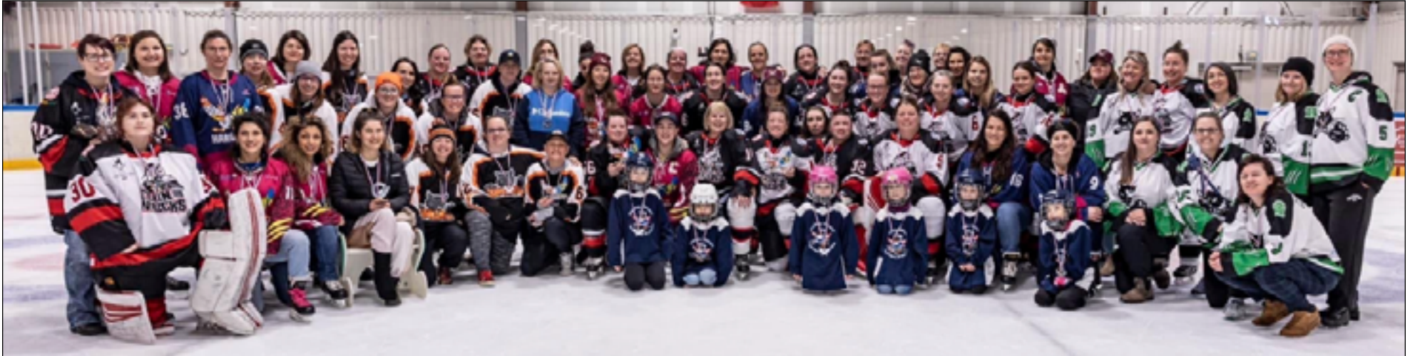
Plusieurs couleurs représentant les équipes terre-neuviennes et saint-pierraises lors de la compétition La Harfangs Classic 2023.

Si le hockey est un sport très populaire à Terre-Neuve-et-Labrador, il l'est aussi chez nos voisines françaises à Saint-Pierre-et-Miquelon! Ce printemps, les hockeuses du Rocher et du Caillou se sont affrontées dans des matchs internationaux qui réunissent des petites équipes autour d'une même passion.