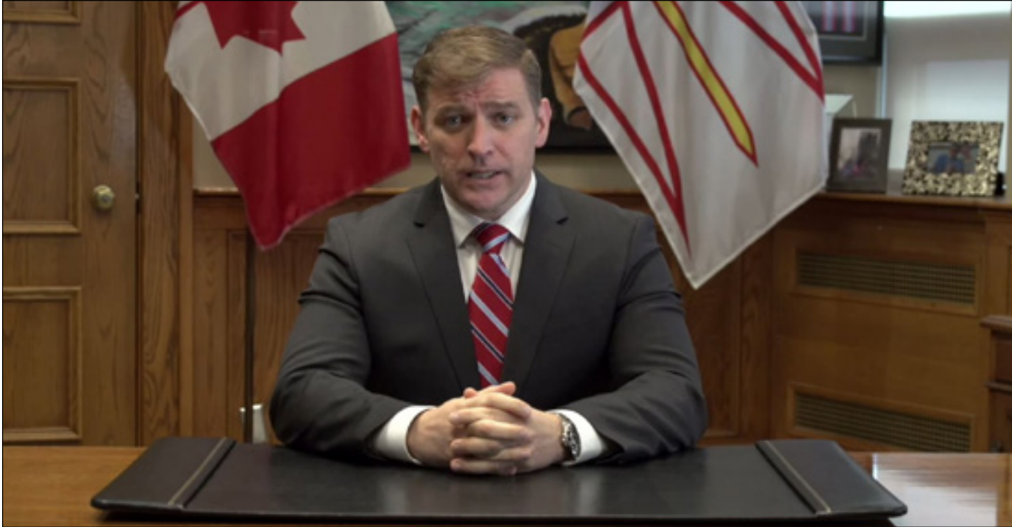
Andrew Furey, premier ministre de Terre-Neuve-et-Labrador lors de sa déclaration le 13 mai dernier.

Le 13 mai dernier, le premier ministre de la province Andrew Furey a livré une adresse à la province afin de faire suite au dépôt, une semaine plus tôt, du rapport de son comité sur la reprise économique 1 . Ce discours exprime certes un volontarisme politique admirable, mais encore une fois, Furey laisse les citoyens entièrement dans le flou quant à ce qu'il s'engage à faire. Un discours donc qui se réduit à n'être qu'une opération de communication qui, paradoxalement, ne veut rien communiquer . Parler afin d'en dire le moins possible.