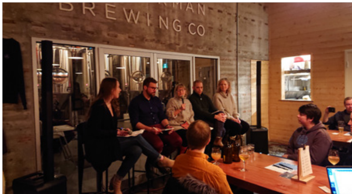
Le panel d'experts et de militants.

Dans la foulée des actions citoyennes réclamant la sécurité pour les piétons qui se sont intensifiées depuis le début de l'hiver, la Social Justice Co-op NL (SJCNL) et Happy City St. John's ont co-organisé une assemblée publique à la brasserie Bannerman le mercredi 19 février. Le but? Continuer la discussion concernant l'état des trottoirs avec un panel d'experts et d'acteurs impliqués dans le dossier.