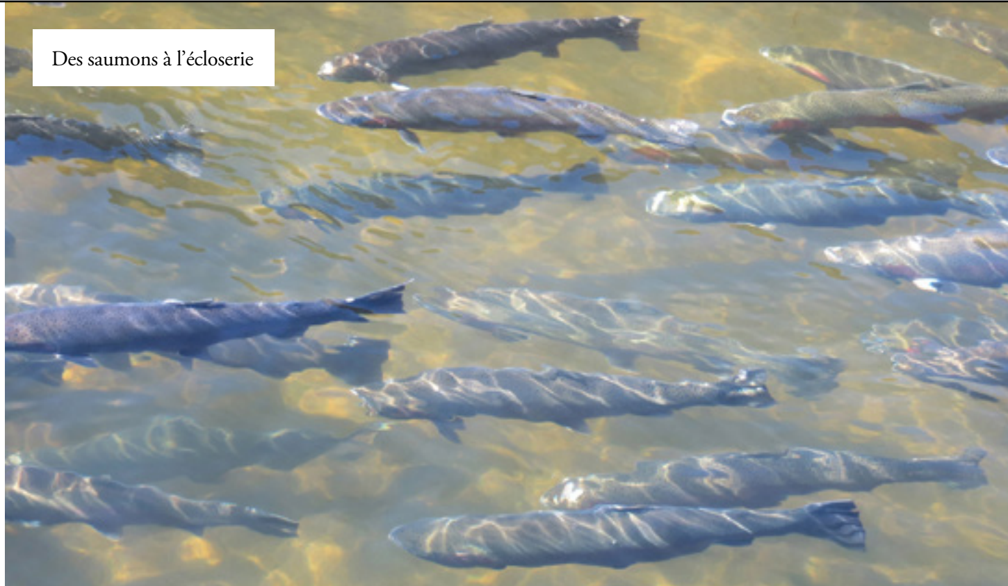
Des saumons à l'écloserie