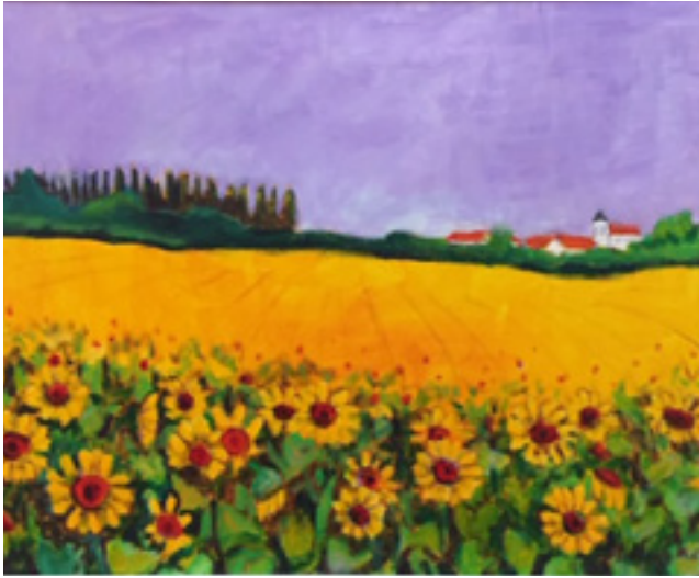
Création : Ilse Hughes

« Ce tableau évoque le soleil du sud-ouest de la France à la fin juin, la saison des tournesols. La culture du tournesol s'est répandue au cours des années, grâce au climat sec, puisque ces fleurs n'ont pas besoin d'irrigation. C'est aussi la saison de la lavande, l'emblème aromatique de la Provence, d'où mon ciel lavande », explique Ilse Hughes.