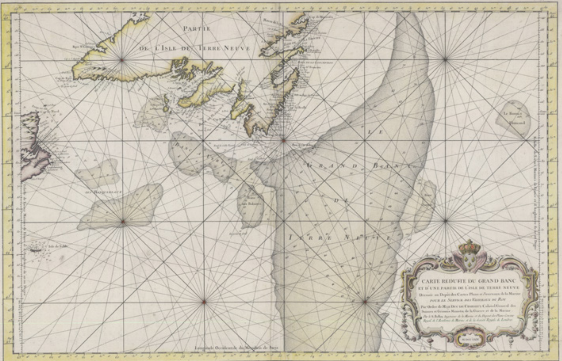
Photo : Jacques Nicolas Bellin (1764), Digital Archives Initiative de MUN