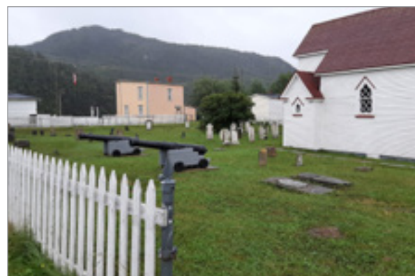
Le cimetière de St. Luke's.

Parfois, découvrir un morceau d'histoire peut être aussi facile que de creuser des trous dans votre jardin. Dans ce cas, faites attention à ne pas déterrer d'os! L'église anglicane St. Luke de Placentia en est un bon exemple. Outre les tombes marquées et gravées en anglais, on y trouve également des tombes basques non marquées qui remontent au XVII e siècle. En fait, il est suggéré que l'église soit même construite par-dessus une chapelle française datant de 1662. Pour en savoir plus sur le type de patrimoine français que vous pouvez trouver dans les cimetières de notre province, consultez le rendez-vous en page 6! (CB)