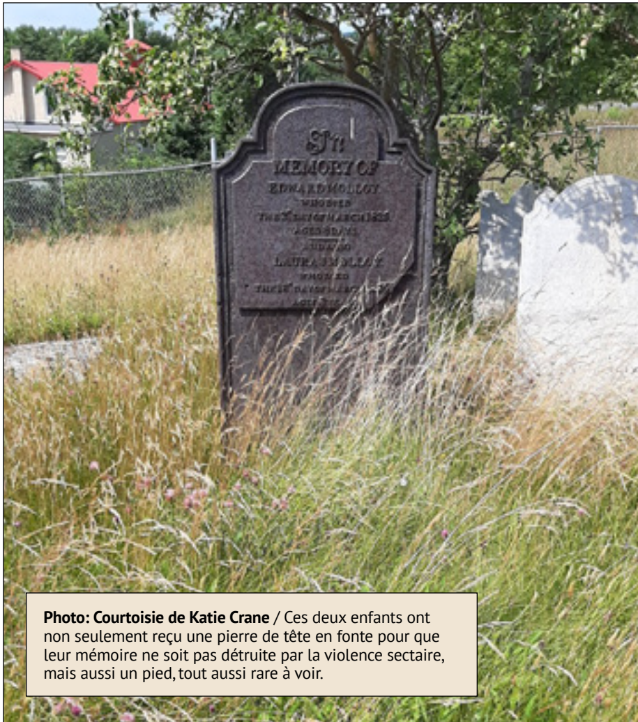
Ces deux enfants ont non seulement reçu une pierre de tête en fonte pour que leur mémoire ne soit pas détruite par la violence sectaire, mais aussi un pied, tout aussi rare à voir.

Pourquoi ces enfants avaient-ils une pierre tombale en fonte? Selon Katie, ils étaient catholiques, mais enterrés dans un cimetière protestant. Les habitants de la région ont été mécontents de cette situation et ont suffisamment détruit la pierre pour que les églises de la région récoltent assez d'argent pour acheter une pierre de tête et de pied en fonte plus durable.