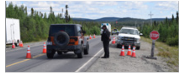
Des agents de la faune sont venus prêter main-forte aux policiers au point de contrôle entre Fermont et Labrador City.

Les Labradoriens eux peuvent circuler librement au Québec qui a ouvert ses frontières à la fin mai. Le barrage routier situé au départ à la frontière a par la suite été reculé un peu plus loin en sol labradorien plus près de Labrador City et les policiers de la Royal Newfoundland Constabulary ont reçu l'assistance des agents de la faune de cette province qui les épaulent dans les vérifications d'usage.