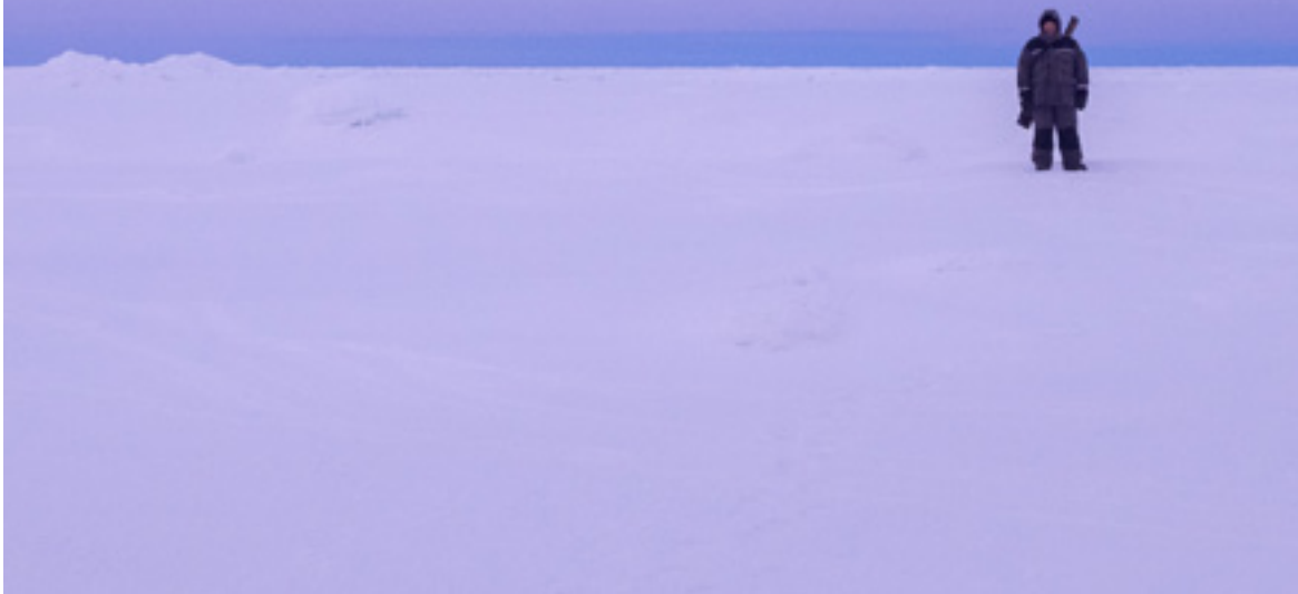
Un garde d'ours polaires aux aguets.

«Tu as finis ton shift de surveillance avec les gardes?» Une surveillance d'un type bien particulière a lieu pendant le déploiement d'instruments sur la glace: observer la banquise pour repérer l'éventuelle apparition d'ours polaires et donner l'alarme au besoin. Les jeunes scientifiques se sont relayés sur le pont pour aider les professionnels en la matière, plusieurs gardes d'ours polaires équipés chacun d'un fusil. Ces gardes ont pour mission d'assurer la sécurité de tous les scientifiques de MOSAiC. Ils passent la journée sur la glace, scrutant l'horizon à la recherche de ces créatures blanches.