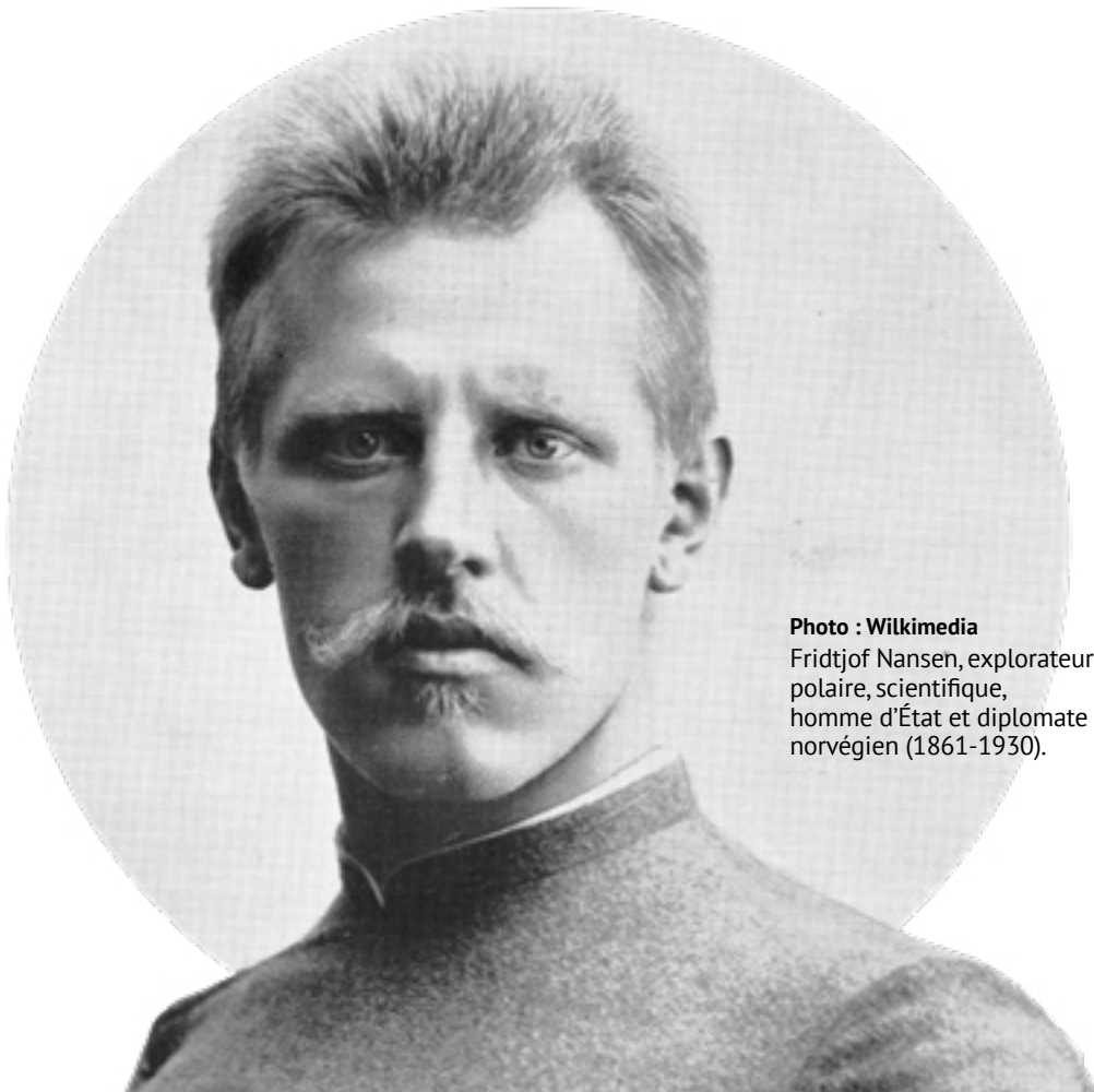
Fridtjof Nansen, explorateur polaire, scientifique, homme d'État et diplomate norvégien (1861-1930).

lement son bateau Fram se faire prendre par les glaces pour dériver. Le but: atteindre le Pôle Nord, exploit encore jamais réalisé. Si leur dérive ne les mènera pas jusque-là, ils se rendront à une latitude de 86°14' N, la plus haute latitude jamais atteinte auparavant. Le Fram sortira des glaces trois ans plus tard. On peut d'ailleurs comparer la trajectoire du Polarstern avec celle du Fram au jour le jour en ligne au follow.mosaic-expedition.org/ .