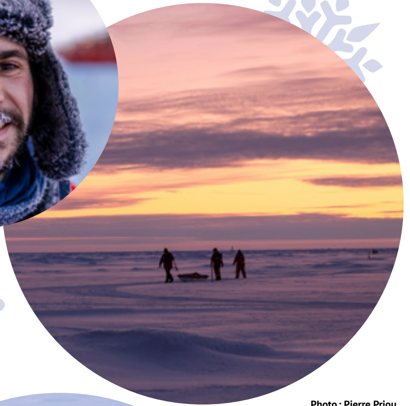
Non, ces étudiants ne font pas de la luge... ils mesurent plutôt l'épaisseur de la glace avec un instrument spécial.