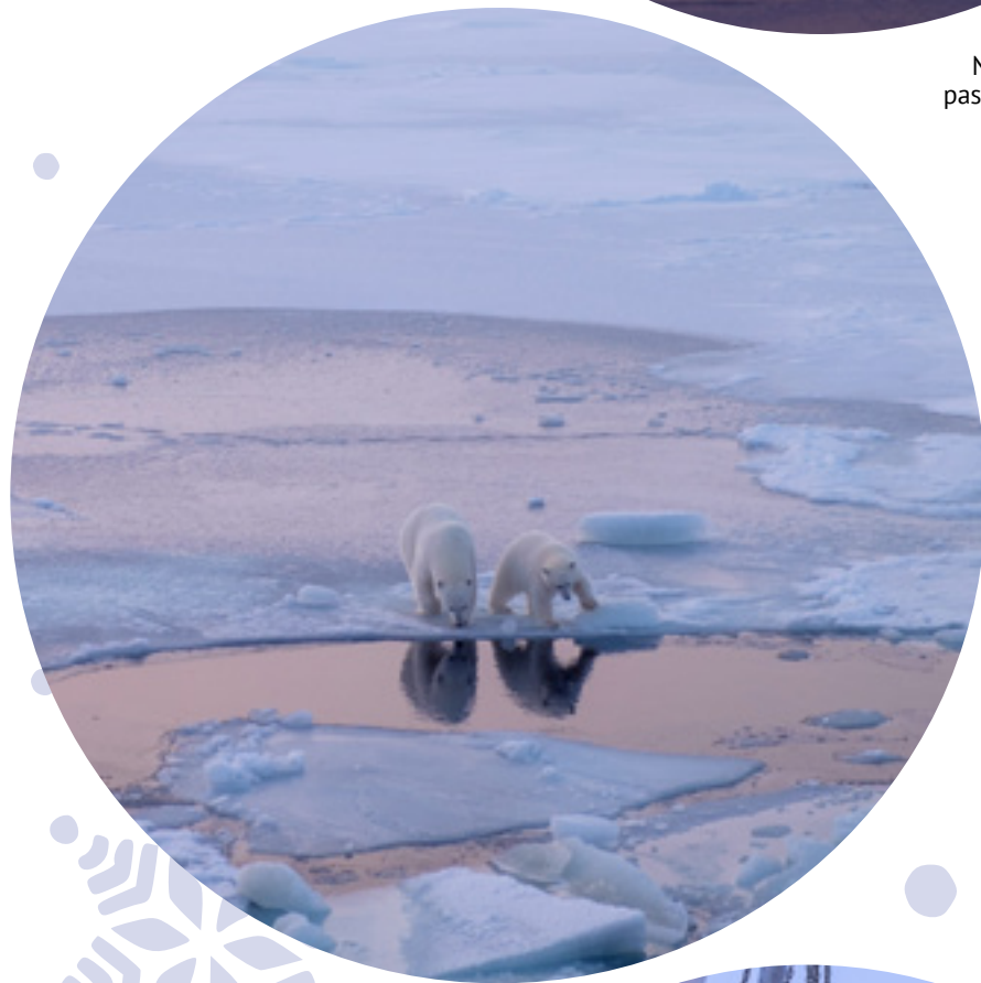
Deux ours polaires se rapprochent du Fedorov , curieux de savoir ce qui se trame chez nos scientifiques polaires.