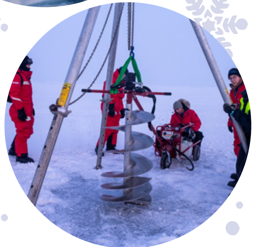
Pour pouvoir déployer les instruments, les scientifiques doivent creuser la glace... comme à la pêche sur glace!