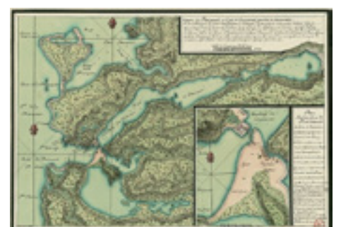
Une carte de Plaisance à la fin du 17 e siècle

à diriger les forces de la Nouvelle-France à l'ouest de Terre-Neuve. (CB)