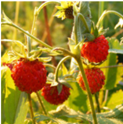
Fraises sauvages