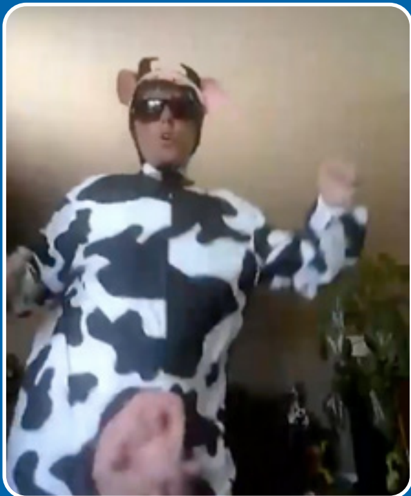
La vache! Le Centre éducatif l'ENVOL, l'école francophone du Labrador City, sait comment bien s'amuser pendant la pandémie - en dansant! Pour voir la vidéo complète et comment la musique peut nous aider en temps difficiles, cliquez ici.

Vous pouvez également partager vos photos de vos expériences en isolement ou des mémés en français sur la COVID-19 avec Le Gaboteur . N'hésitez pas à nous les transmettre sur nos pages Facebook , Twitter , ou Instagram . Vous pouvez également nous les envoyer par courriel à info@gaboteur.ca !