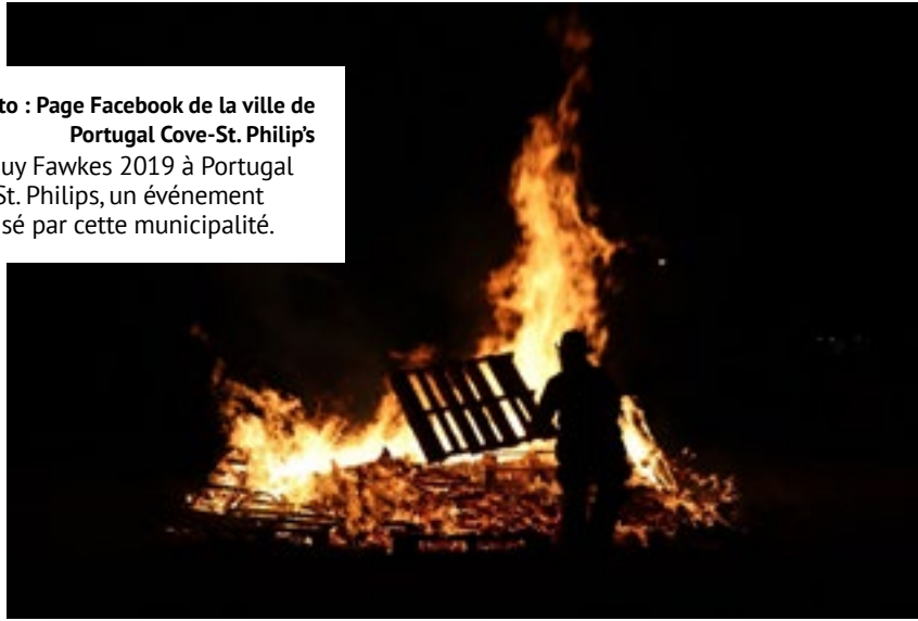
Nuit Guy Fawkes 2019 à Portugal Cove-St. Philips, un événement organisé par cette municipalité.

Si vous connaissez la chanson folklorique qui inspire le titre de ce dossier et la suite de son refrain, « les garçons les filles avec », vous êtes sans doute originaire du Québec ou d'une autre région francophone du Canada.