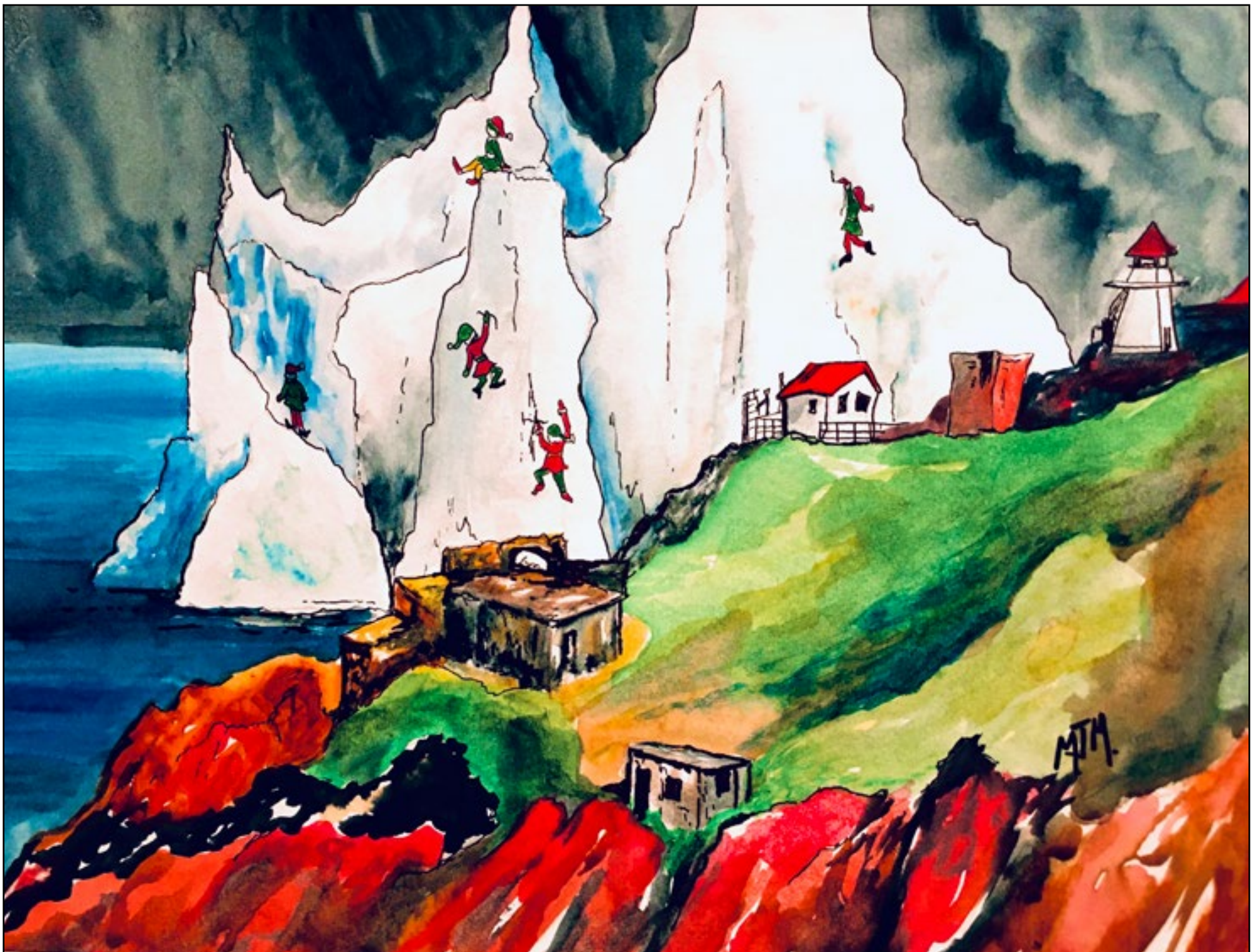
Illustration : Marie-José Mahé