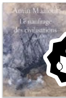
Photo : Naufrage des civilisations Couverture du plus récent essai d'Amin Maalouf, membre de l'Académie française.

Le premier bouquin est celui d'Amin Maalouf, auteur franco-libanais de l'Académie française intitulé Le Naufrage des Civilisations (Édition Grasset). Dans son enquête sur le « mal du monde » et inspiré par ses