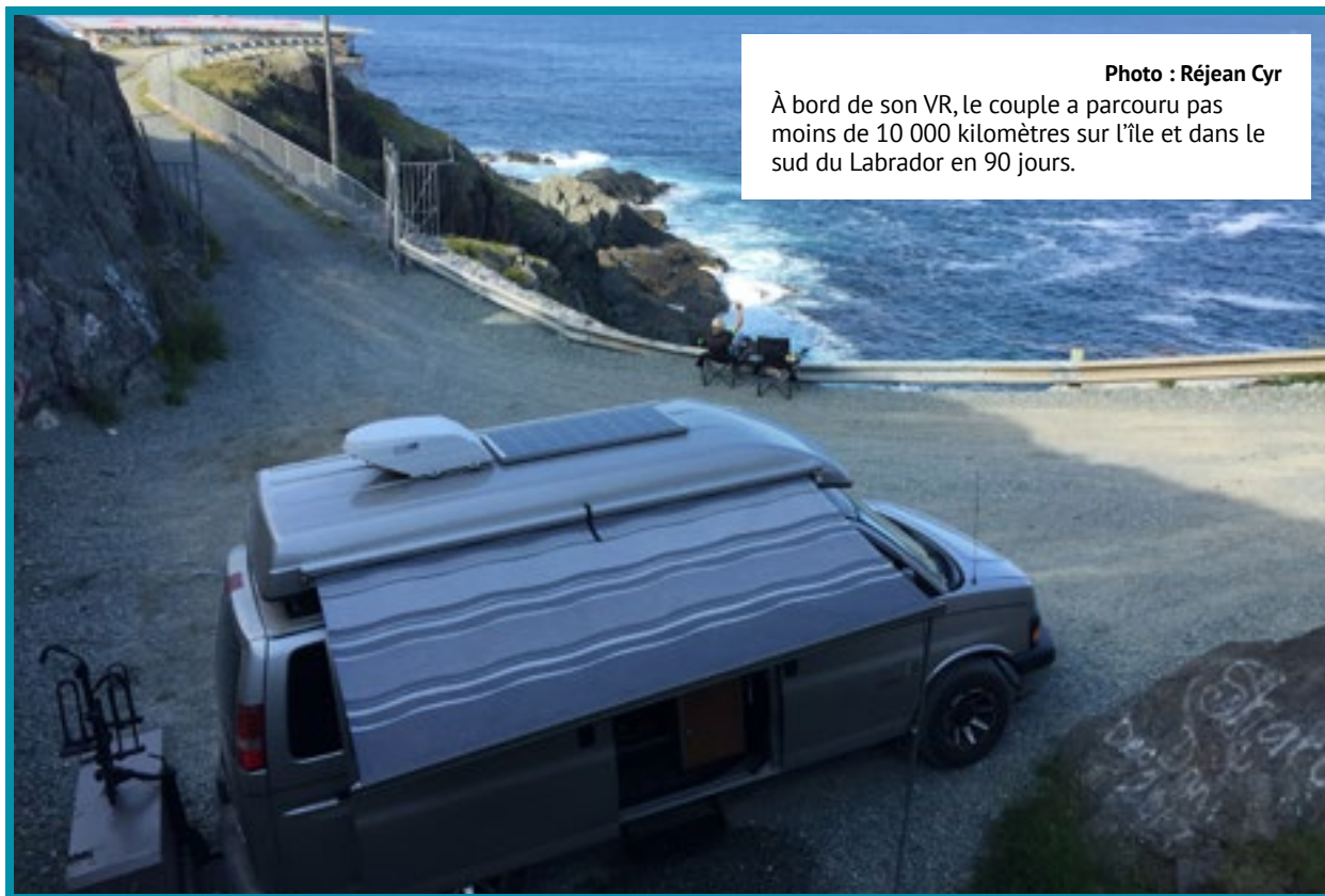
À bord de son VR, le couple a parcouru pas moins de 10 000 kilomètres sur l'île et dans le sud du Labrador en 90 jours.

« Avec les photos qu'on a mises sur Facebook, c'est certain que d'autres Québécois vont avoir envie de venir visiter Terre-Neuve! », a-t-il prédit.