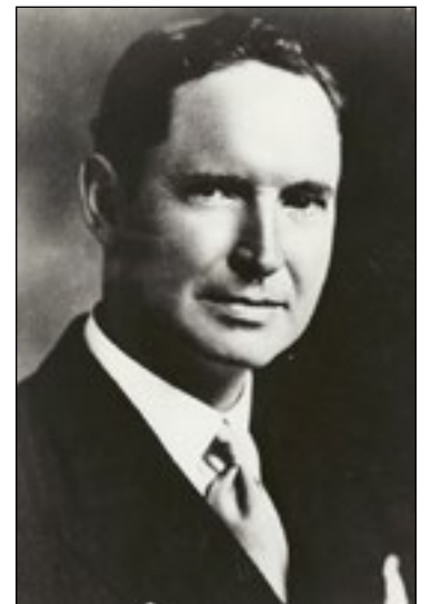
L'architecte Thomas Adams a conçu le premier plan d'urbanisme de la ville de Corner Brook.

À Terre-Neuve, sa plus célèbre intervention est la conception du plan d'urbanisme de la ville de Corner Brook, dans les années 1920. (Source : Parcs Canada).