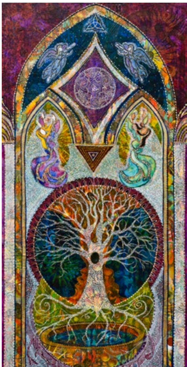
Chaque point une prière (Every Dot a prayer). La lumière de vitraux d'église et les suggestions de dizaines de personnes ont inspiré la francophone Dominique Hurley pour la création de l'œuvre Chaque point une prière , gagnante d'un Prix des arts et des lettres en arts visuels 2019 chez les seniors.