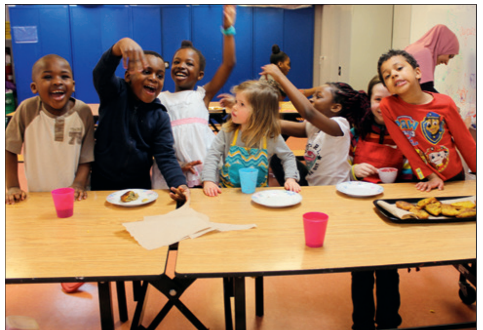
Dégustation, rires et un peu de bousculade sur être sur la photo.