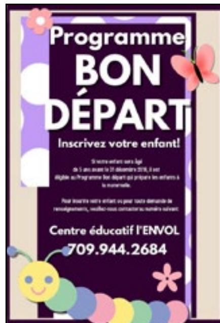
Affiche du programme Bon départ de l'ENVOL

Le 8 décembre dernier, les élèves du Centre éducatif l'ENVOL ont participé à une collecte de fonds pour financer des activités spéciales tout au long de l'année. Ils ont ainsi offert des services d'emballage de cadeaux et on vendu des pâtisseries à la sortie d'un grand magasin. En espérant que leurs efforts auront porté fruit !