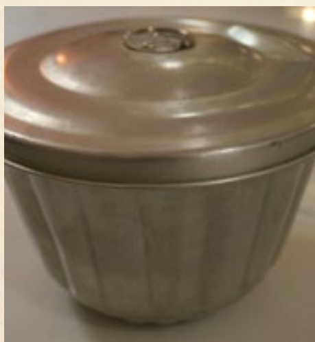
Moule à pouding à la vapeur