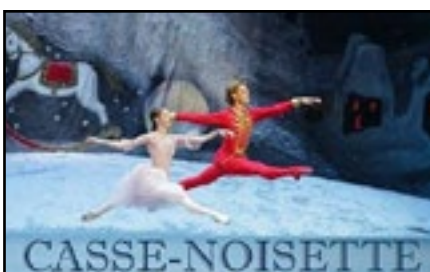
Affiche du spectacle Casse-Noisette.

Enfin, du 18 au 22 décembre, les élèves de l'école seront invités à participer aux Cinq jours de Noël , durant lesquels ils auront à se déguiser chaque jour de manières différentes, question de faire passer le temps plus vite avant LE grand jour.