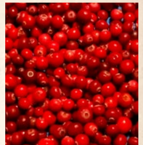
Lingones (partridge berries, lingonberry)

Même si la préparation de cet autre mets traditionnel laisse place à la créativité, madame Benoit Churchill a quand même un jour donné à ses enfants une recette qui inclut des quantités pour chaque ingrédient. La voici.