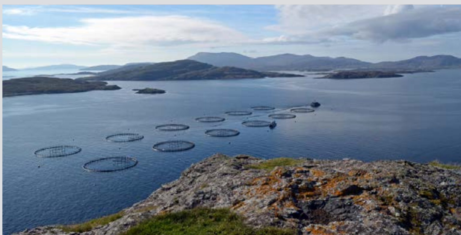
Ferme de saumon d'élevage à Hellisay, en Écosse.

Cette vision n'est pas partagée par la NAIA, l'Association de l'industrie aquacole de Terre-Neuve-et-Labrador. Dans un communiqué de presse diffusé le 29 mars, l'association, qui représente une centaine de compagnies actives dans ce domaine, déclarait : « Notre industrie et ses membres respectent et dépassent, dans de nombreux cas, les rigoureux règlements provinciaux et fédéraux. En outre, nos membres accomplissent volontairement des certifications tierces de niveau international, telles les normes BAP et biologiques ».