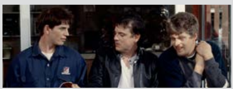
Les comédiens Sébastien Delorme, Claude Legault et Réal Bossé dans une scène de Gaz Bar Blues , du réalisateur Louis Bélanger.

À compter de 18 h 30, dans la salle 2109 de l'édifice des sciences de l'Université Memorial, les cinéphiles pourront voir