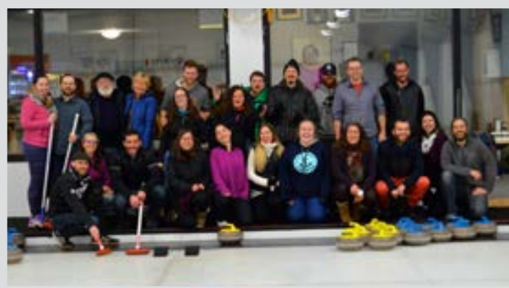
Une vingtaine de membres du groupe French Fridays St. John's et de l'Association communautaire francophone de Saint-Jean (ACFSJ) se sont « piqués » aux défis du curling le 24 mars dernier.

Pour autant, pas le temps de respirer, c'est à mon tour de lancer une pierre. C'est pour