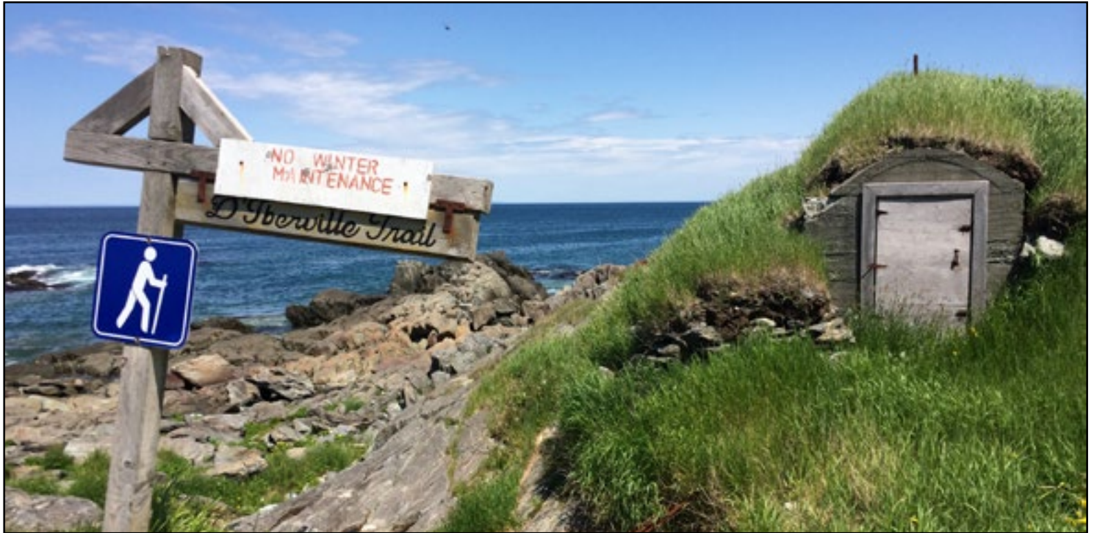
Photo du sentier d'Iberville dans la baie de Trinity.

Dans la page Wikipédia consacrée à cet épisode de la carrière de d'Iberville, on retrouve ces précisions sur son parcours. « d'Iberville et ses soldats quittent Plaisance le 1er novembre 1696