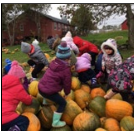
Citrouilles d'escalade à la ferme Lester

Les copains de la maternelle de l'école des Grands-Vents ont eu beaucoup de plaisir le 23 octobre dernier lors de leur visite à la ferme Lester, à Saint-Jean. Les enfants ont pu faire connaissance, entre autres, de monsieur l'âne gris, d'un lama et d'un cheval, des moutons, des petits et gros cochons et... d'une montagne de citrouilles tout à fait appropriée à la pratique de l'escalade. Malgré des conditions météo plutôt fraîches, les enfants ont porté fièrement leurs plus beaux sourires pour l'occasion. Un grand merci aux enseignantes de la maternelle Mme Flavie et Mme Chelsea ainsi qu'à Mme Fanny !