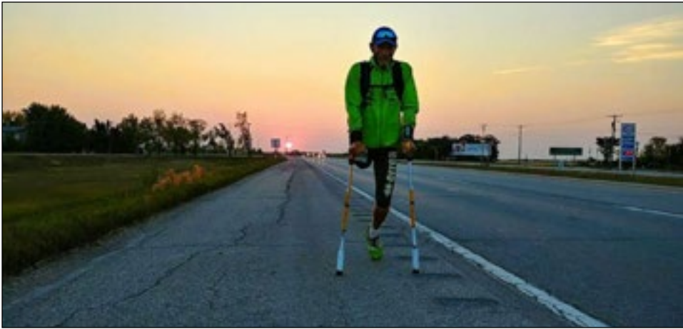
Lever du soleil au Manitoba, près de Élie.

Ces images permettent de mieux comprendre leur contact au quotidien avec quelqu'un qui se mesure à l'infini, et trouve réconfort avec les animaux qui l'habitent.