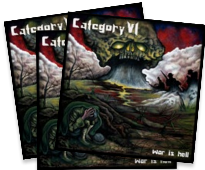
Couverture du plus récent CD de Category VI, dans lequel on retrouve Crossing the Avalon.

Notre traduction d'un passage de la chanson Crossing the Avalon, de Geoff Wayne