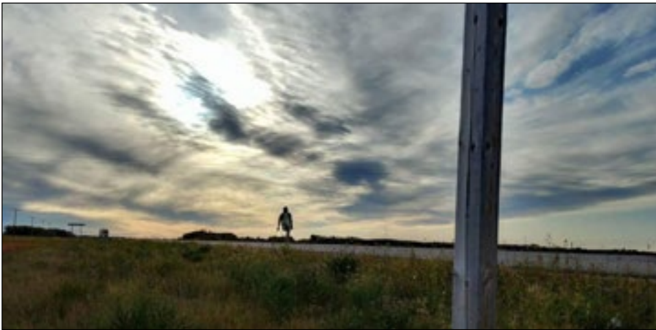
Un des milliers de ciels fabuleux de la Saskatchewan.