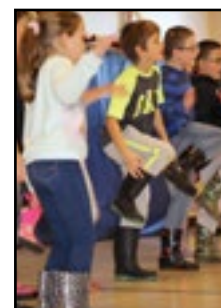
Atelier de gumboots à La Grand'Terre.

Les élèves de l'École Sainte-Anne ont eu aussi participé au Jamarama du 18 octobre dernier et ont pu amasser environ 320 $ pour l'hôpital pour enfant Janeway . Bravo aux élèves pour leur implication.