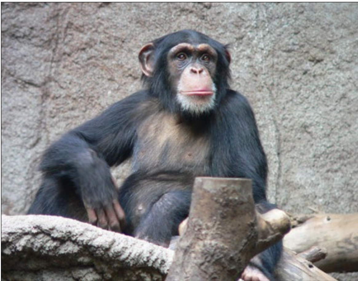
Chimpanzé du zoo de Leipzig.