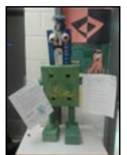
Le gentil monstre de Boréale.

Dans le cadre des cours de français et d'arts plastiques, et afin de souligner la fête de l'Halloween, les élèves de 6e et 7e année ont eu à construire un monstre géant, en équipe, et rédiger des histoires en lien avec celui-ci.