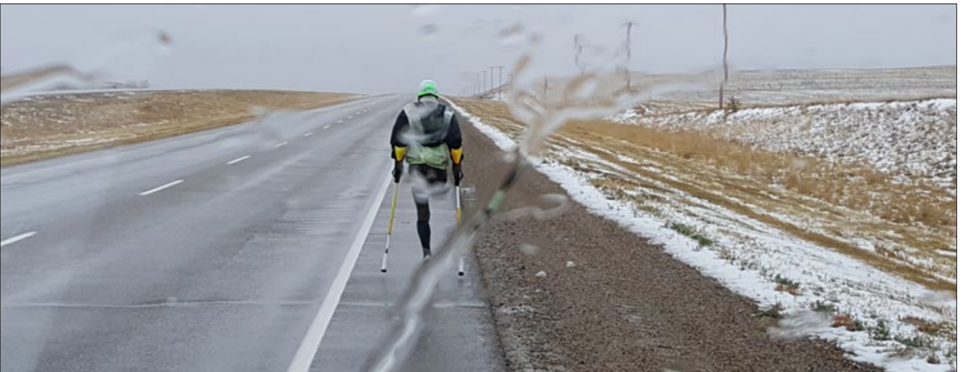
Jour de pluie et d'arc-en-ciel à Medicine Hat, en Alberta.