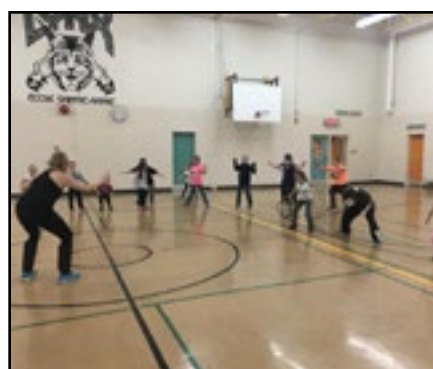
Vive la danse en bottes de pluie!

Cette activité de danse a été proposée par le Réseau immigration francophone de Terre-Neuve-et-Labrador et le Projet Ose afin de souligner la Semaine nationale de l'immigration francophone 2017 et de célébrer la diversité culturelle.