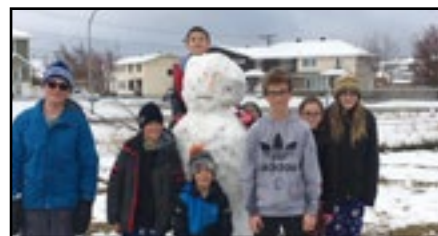
Octobre à Labrador City...

Le Jamarama du 18 octobre s'est également déroulé du côté de Labrador City. Le Centre éducatif L'ENVOL s'est joint au mouvement et a réussi à amasser un gros 150 $ pour l'occasion. Tout le monde, incluant M. Bonhomme de neige, semblait très heureux d'avoir pu garder son pyjama en sortant du lit.