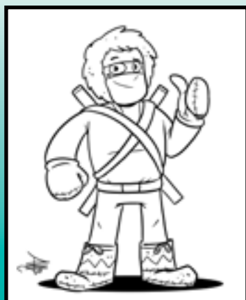
LE GARDIEN DE PAIX

Nous sommes les nouveaux héros des Aventures du gaboteur Venez nous visiter au Labrador