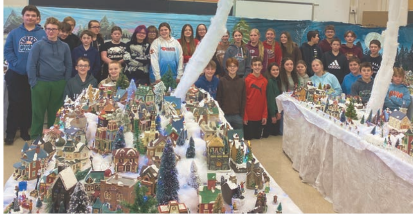
Les élèves de la 8 e année de l'École catholique St-Louis ont fait de beaux tableaux pour décorer le village de Noël.

Pour la réalisation de ce projet, Mme Leroux a obtenu l'aide des élèves de la 8 e année, qui ont été chargés de faire toute la peinture de l'arrière-plan pendant une semaine. Ils l'ont également aidée à construire le village, ce qui a pris une autre semaine.