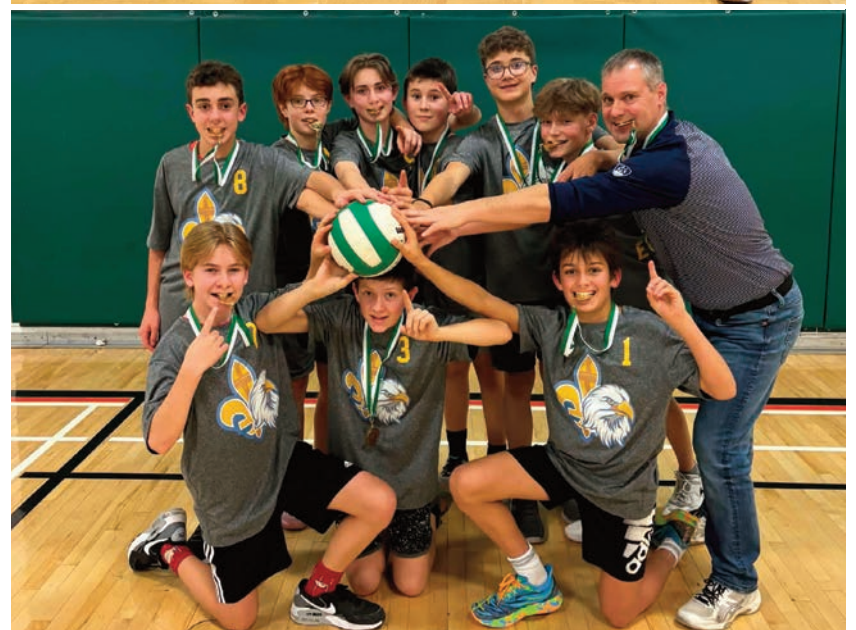
L'équipe féminine de la 8 e année, de la 7 e année et l'équipe masculine de la 8 e année de volleyball de l'École catholique St-Louis de Hearst