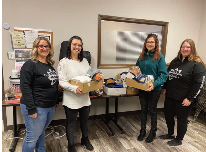
L'équipe de Partenaires en action ramasse les cadeaux offerts par les entreprises soutenant leur projet, afin de préparer les tirages prévus le 10 décembre.

Pour les personnes qui souhaitent participer au tirage des prix, indique la prospectrice d'emploi, il suffit de se rendre dans les entreprises participantes pour y inscrire leur nom dans le tirage. Pour plus d'informations, une affiche est disponible sur la page Facebook du Centre Partenaires pour l'emploi, accompagnée de la première vidéo de lancement du projet Partenaires