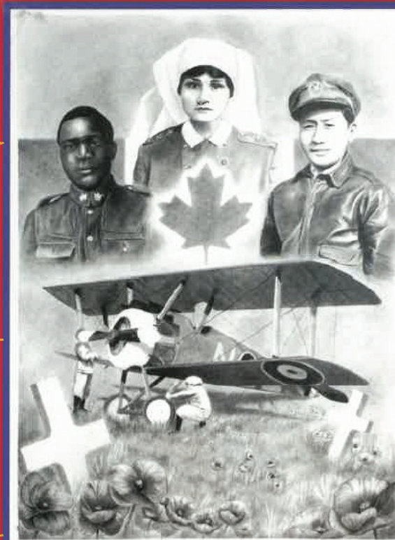
Affiche créée par ISABELLA HUANG Calgary (Alb.)

Jour du souvenir Vous qui nous avez tant aidé Nous qui devons vous respecter Les soldats sont des rois Admirez leur exploit Il faut rendre hommage À ceux qui ont du courage Il faut se souvenir De tout ce qu'ils ont dû subir Nous devons être reconnaissants Envoyez des combattants Vous réalisez dans nos cœurs En portant cette magnifique fleur Nous restons debout en votre honneur En pensant à tous ces malheurs Quand les soldats sont tombés Les combattants ont poussé Une historique journée Le jour de leur anniversaire Les soldats qui ont foulé la terre Pour nous défendre de cette guerre Sont pour tous de courageux vainqueurs Malgré les déchirures qui ont marqué leur cœur Ils ont été des familles, comme vous et moi Nous pensons à vous, valeureux soldats