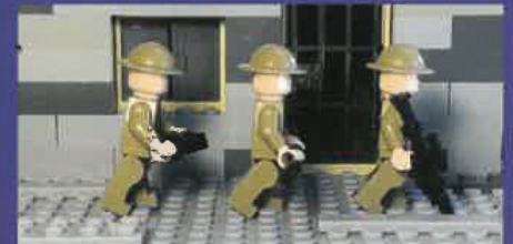
Vidéo produite par GUS CASSIDY Saint John (N.-B.)

Poème de MAÏNA GUAY Notre-Dame-du-Mont-Carmel (Qc)