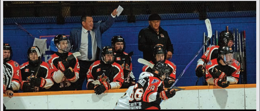
Les Jacks se sont inclinés par la marque de 6 à 0 devant le Rock de Timmins, qui obtenait ainsi sa revanche après le revers de 7 à 3 vendredi dernier à Hearst.