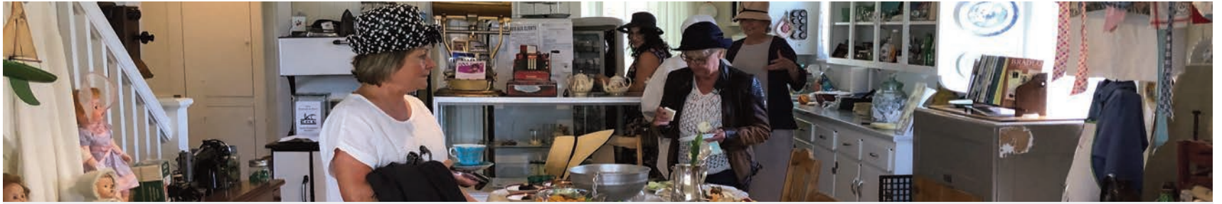
En mode préparation pour servir la nourriture aux participants.