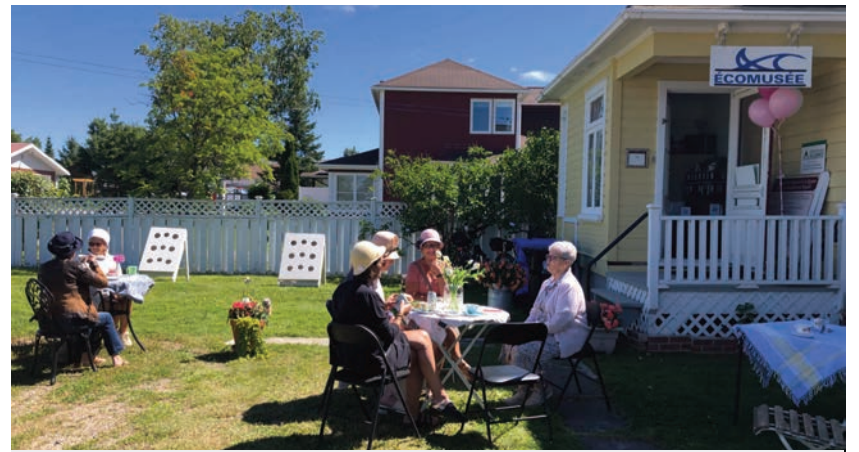
Certains participants du thé Garden Party sont sortis pour profiter du soleil.