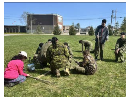
Les cadets à l'œuvre dimanche dernier

Plusieurs cadets participaient pour la première fois à une expérience sur le terrain comme celle-ci. L'officière Rhéaume a même souligné qu'un des jeunes a intégré leur groupe tout