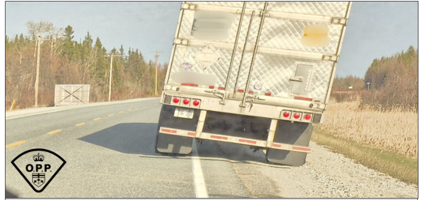
Camion en question arrêté à Mattice-Val Côté

Le conducteur est attendu devant la Cour de justice de l'Ontario, division des infractions provinciales, le 15 juillet 2025 à Hearst.