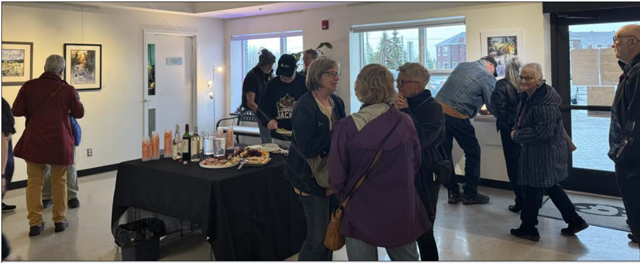
Le public se presse à la Galerie 815 pour découvrir l'exposition « Regard sur la forêt boréale » de l'aquarelliste Martha Heidenheim. L'évènement attire les amateurs d'art venus admirer ses œuvres inspirées des paysages du Nord ontarien.