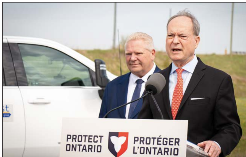
Doug Ford et Peter Bethlenfalvy, ministre des Finances, lors d'une allocation au cours des dernières semaines

Le budget propose plusieurs mesures phares. Il prévoit notamment un investissement de 500 millions de dollars pour la création d'un Fonds pour le traitement des minéraux critiques, afin de stimuler l'investissement dans la transformation locale de ces ressources et de renforcer l'expertise ontarienne dans ce secteur stratégique. Le soutien aux partenariats autochtones est également renforcé, avec un triplement du montant alloué au Programme de financement pour les initiatives autochtones, porté à 3 milliards de dollars, et un élargissement de l'admissibilité à des secteurs comme l'énergie, l'exploitation minière et les pipelines. Par ailleurs, le gouvernement consacre 70 millions de dollars sur quatre