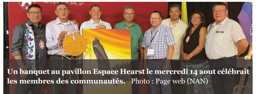
Un banquet au pavillon Espace Hearst le mercredi 14 août célébrait les membres des communautés.

Il a été directeur de la santé de la Nation Nishnawbe Aski de 1998 jusqu'à son élection au conseil exécutif en 2003. Il a rempli plusieurs mandats consécutifs en tant que Grand Chef adjoint avant de rejoindre la Commission de vérité et de réconciliation en tant que responsable des liaisons régionales et de la région de l'Ontario en 2010.