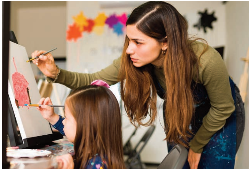
La Ruchée

La ruchée a présenté le 20 juin le bilan de ses réalisations 2022-2024. Les résultats démontrent