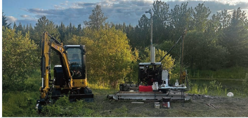
L'explorateur en herbe a rejoint l'un des géologues du projet, le samedi 20 juillet dernier, à Jogues. Sur place, il y avait une foreuse de petite taille, qui perce le sol et la roche en utilisant un foret de deux pouces.