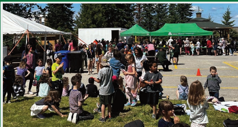
Journée d'appréciation des membres de la Caisse Alliance de Hearst. Le personnel de l'institution financière a servi un dîner à toutes les personnes qui se présentaient le mercredi 12 juin 2024. Au son de la musique du groupe Duo Kermesse, petits et grands ont dégusté des hotdogs et autres collations, une gracieuseté de la Caisse. Des enfants s'amusaient même dans le parc d'eau.