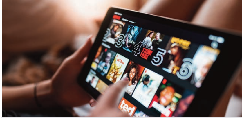
Les services de diffusion continue en ligne devront verser 5 % de leurs revenus au Canada pour financer du contenu canadien dès septembre.

La directrice générale de l'Alliance nationale de l'industrie musicale