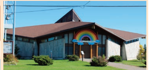
La cathédrale Notre-Dame-de-l'Assomption