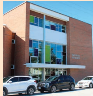
Le bâtiment de l'Université de Hearst et du Collège Boréal.