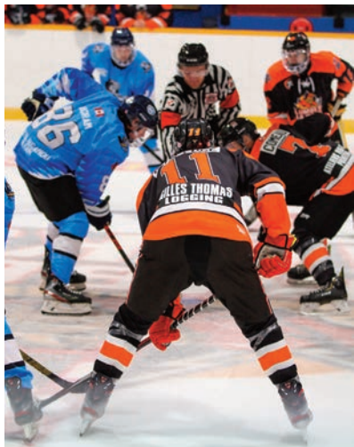
Pages 15 et 16