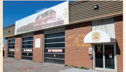
La caserne des pompiers de Hearst

Cette chronique est une présentation du 100 e de la Ville de Hearst