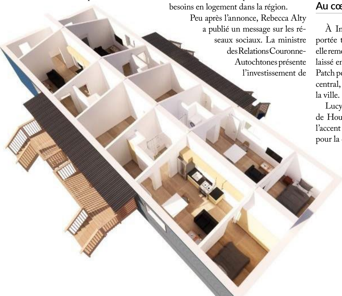
Vue d'artiste du projet annoncé sur le site du Blueberry Patch, à Inuvik, où 40 logements sociaux doivent être construits grâce à un financement fédéral et territorial.

Pour l'instant, l'annonce précise le financement et le nombre d'unités prévues, mais pas le calendrier du projet. Ni la date du début des travaux ni celle de la livraison des logements n'ont été annoncées.