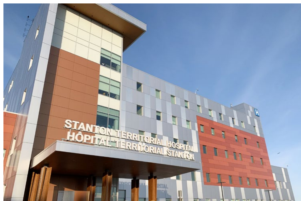
Le GTNO a diffusé sa réponse aux recommandations d'un audit qui dresse un portrait critique des soins primaires en français aux Territoires du Nord-Ouest.

La méthodologie du rapport mérite aussi d'être notée. L'exercice reposait sur une revue documentaire, des entretiens avec des usagers ou proches aidants, ainsi qu'avec du personnel et des gestionnaires. La cible fixée était de 50 entretiens auprès d'usagers et de 20 à l'interne. Le rapport indique qu'il en a finalement mené 15 avec des patients ou proches aidants, ainsi que 14 à l'interne auprès du personnel ou de gestionnaires.