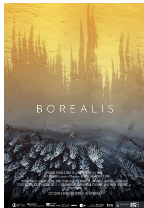
Affiche du documentaire

bouleversée par l'activité humaine. Déforestation, gaz à effet de serre, multiplication des incendies : autant de phénomènes qui déstabilisent un système pourtant résilient. Les feux de forêt font partie du cycle naturel et permettent même à certains arbres de se régénérer, mais le réchauffement climatique en change l'échelle. Les sols deviennent plus secs, les incendies plus intenses et plus longs, au point de parfois persister d'une année à l'autre.