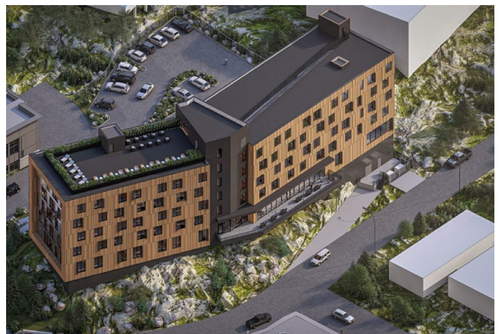
Ce rendu illustre le projet d'hôtel de 150 chambres que Nunastar souhaite construire à côté de l'hôtel Explorer, sur la 49e Avenue.