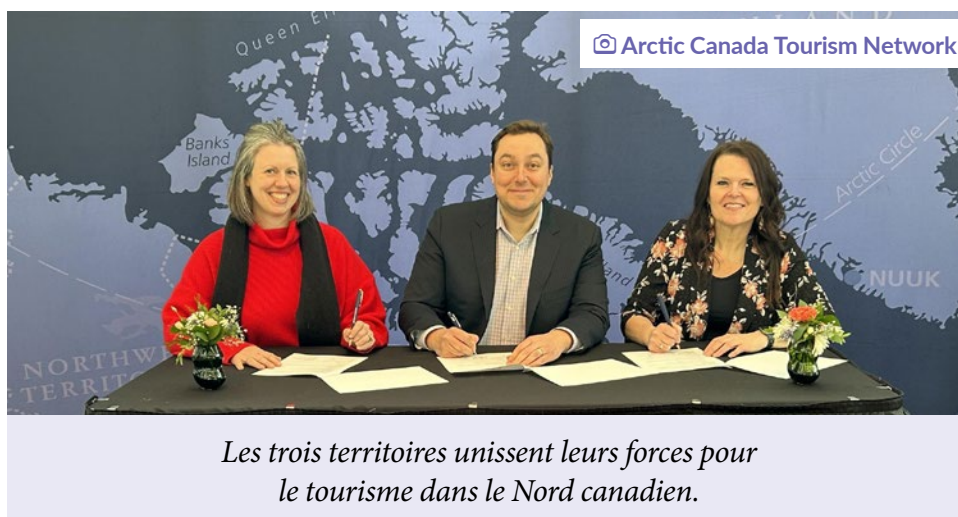
Les trois territoires unissent leurs forces pour le tourisme dans le Nord canadien.

Le territoire accueille approximativement 50 000 visiteurs chaque année, incluant les déplacements d'affaires. On compte entre 140 à 150 opérateurs touris-