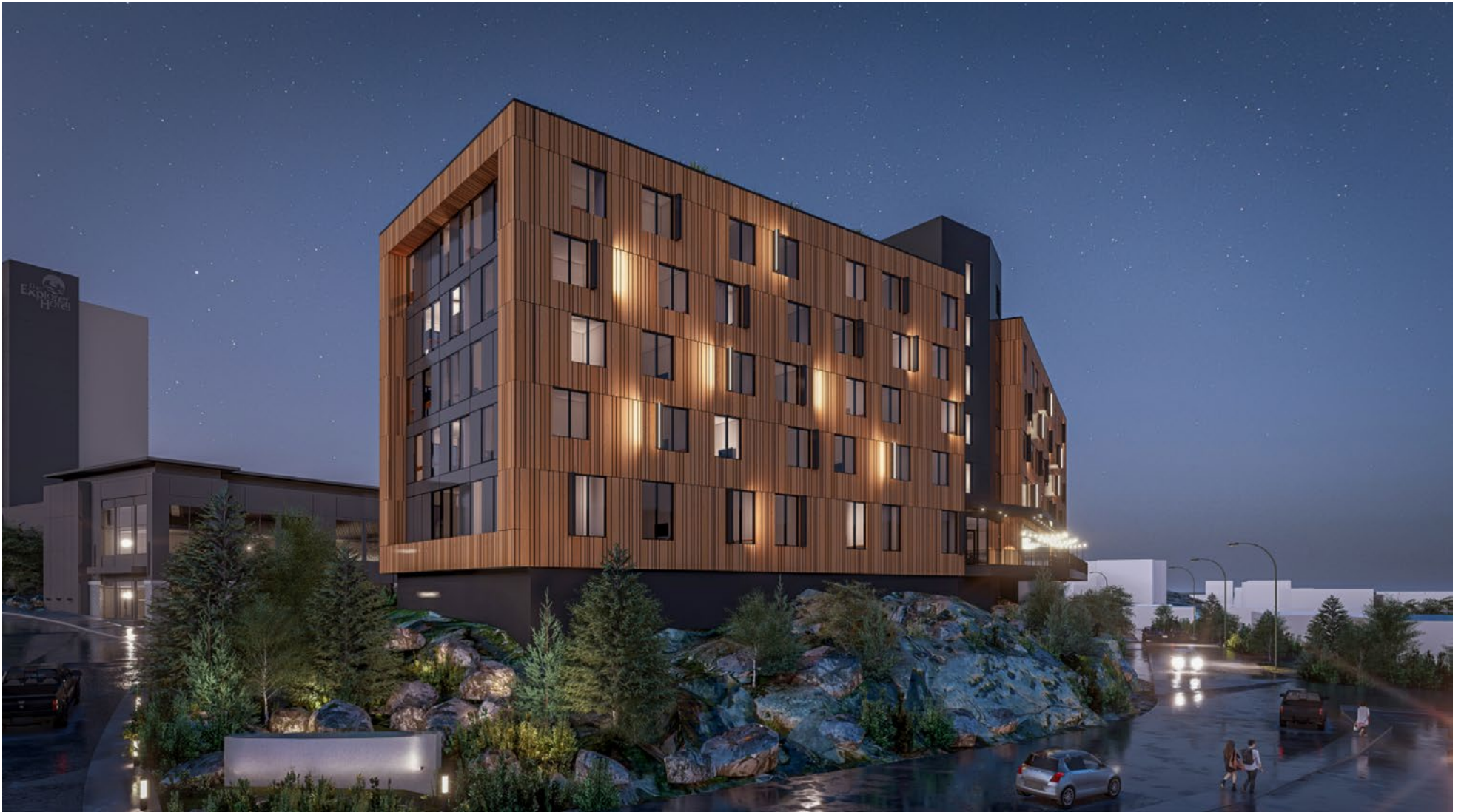
Vue d'artiste du futur hôtel envisagé par Nunastar à côté de l'hôtel Explorer, le long de la 49e avenue à Yellowknife.