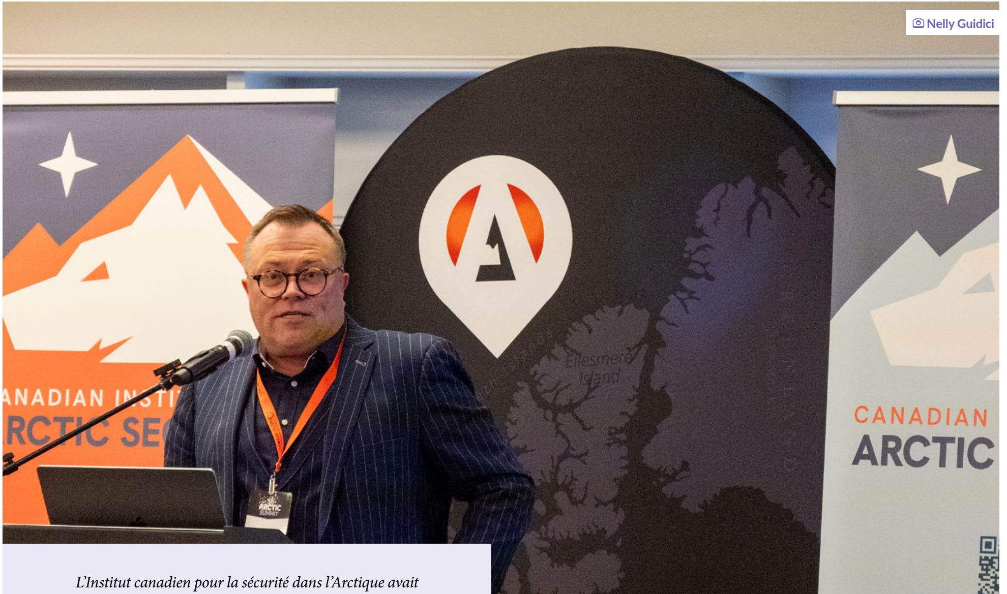
L'Institut canadien pour la sécurité dans l'Arctique avait été lancé sous la forme d'un projet pilote de 18 mois. Il a cessé toutes ses activités le 31 mars 2026.