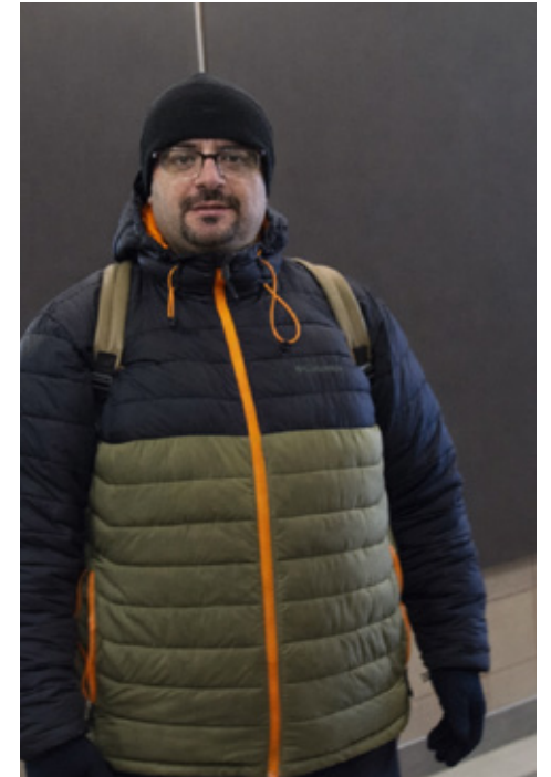
Pour Nashat, les femmes ne devraient pas être célébrées.

pays musulman, il explique que, selon lui, les femmes ne devraient pas être célébrées un seul jour par année, mais honorées chaque jour. Il souligne également que,