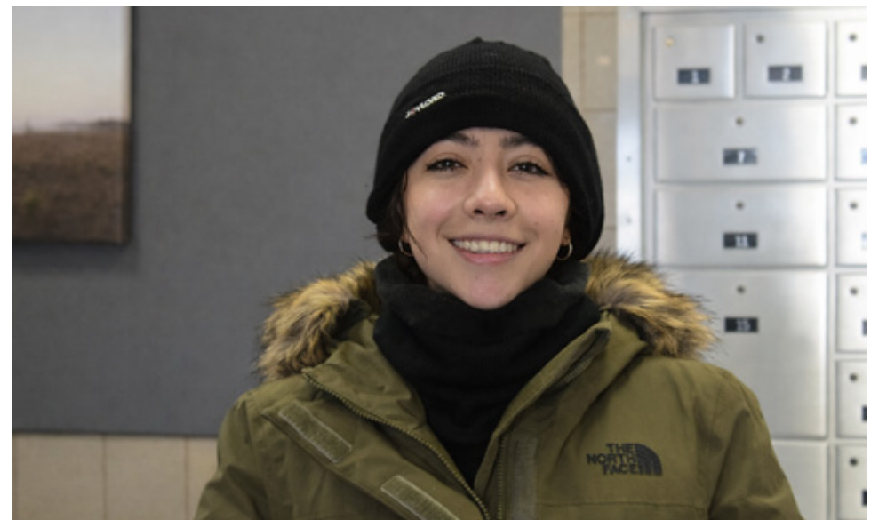
Barbara voit dans cette journée « un moment pour vraiment reconnaître ce que signifie être une femme ».

pour les nouvelles arrivantes, le principal défi peut être de s'intégrer à une nouvelle culture et au marché du travail.