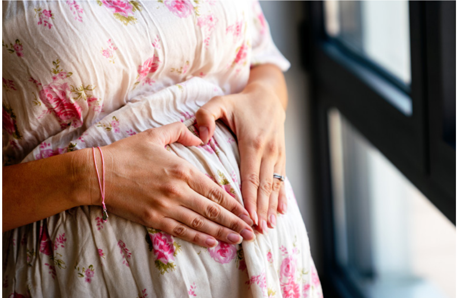
Une femme impatiente de rencontrer son enfant à venir.

Le guide, qui compte plus de 60 pages, aborde le suivi prénatal, la gestion des inconforts, la nutrition, la préparation à la naissance, l'accouchement, le rôle du partenaire, le post-partum, l'allaitement, le sommeil sécuritaire du bébé et la santé mentale périnatale. On y trouve également les ressources gouvernementales et communautaires disponibles aux TNO. « Le