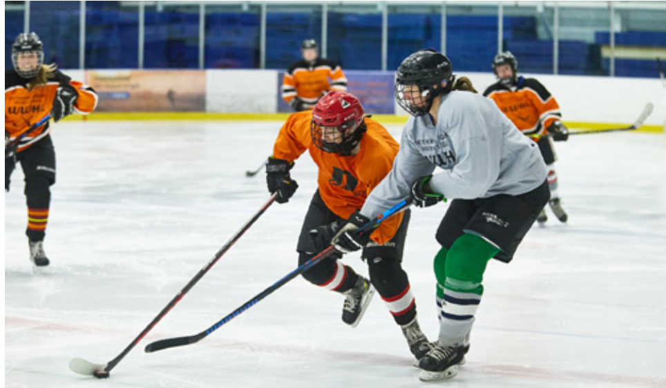
Le hockey féminin gagne en popularité et en visibilité au Canada et dans les communautés francophones.

Elle a commencé à jouer à la ringuette en 8 e année avant de se mettre au hockey, au secondaire. « Il n'y avait pas beaucoup d'équipes féminines à l'époque », rapporte