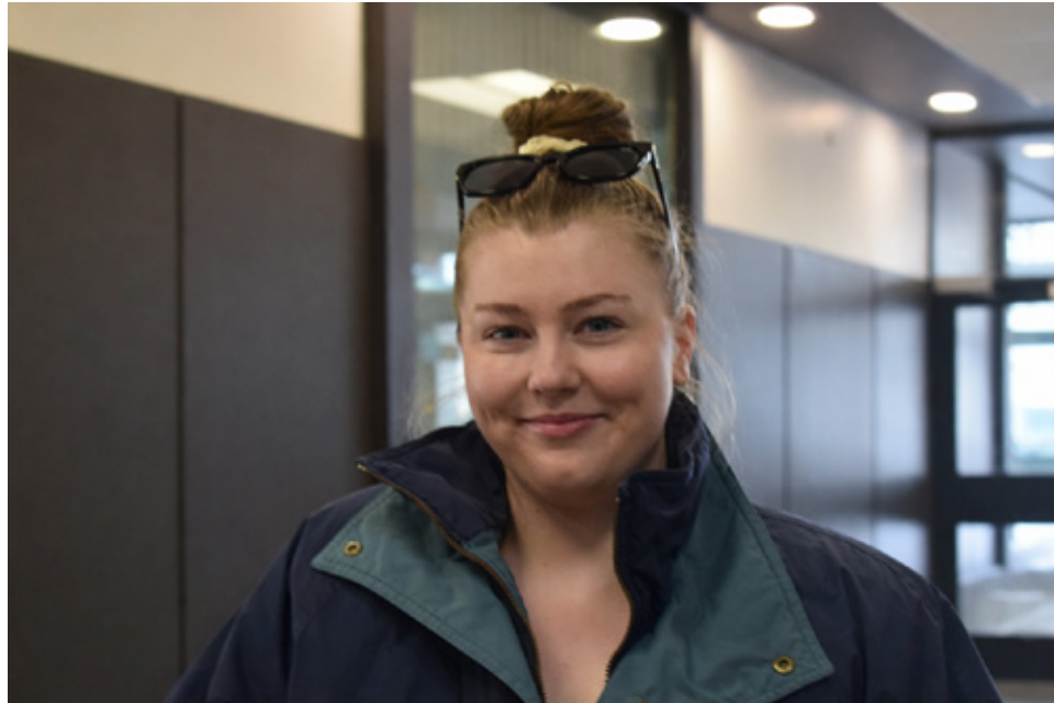
Taylor estime que le plus grand défi reste le manque de respect et d'espace accordé aux femmes.

De son côté, Barbara voit dans cette journée « un moment pour vraiment reconnaître ce que signifie être une femme ». Elle souligne toutefois que les défis demeurent nombreux, notamment